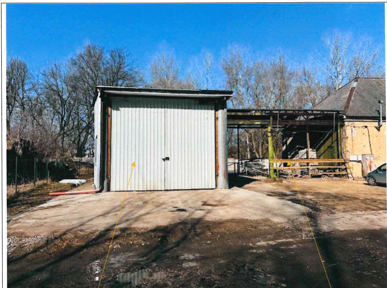
Foto lentelės prie 2026 m. kovo 31 d. patikrinimo akto Nr. ŽPa-28 tęsinys: (data) (registracijos numeris)

Nuotraukos Nr. 10 (eilės numeris ir aprašymas)