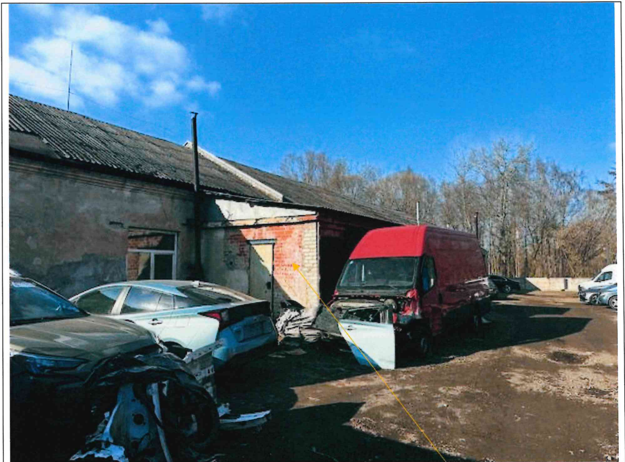
Foto lentelės prie 2026 m. kovo 31 d. patikrinimo akto Nr. ŽPa-28 tęsinys: (data) (registracijos numeris)

Nuotraukos Nr. 6 (eilės numeris ir aprašymas)