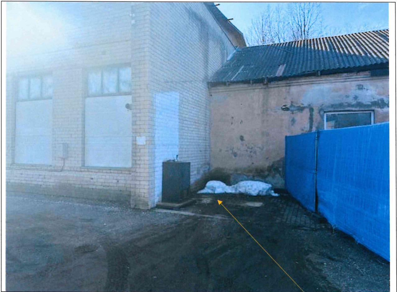
Foto lentelės prie 2026 m. kovo 31 d. patikrinimo akto Nr. ŽPa-28 tęsinys: (data) (registracijos numeris)

Nuotraukos Nr. 5 (eilės numeris ir aprašymas)