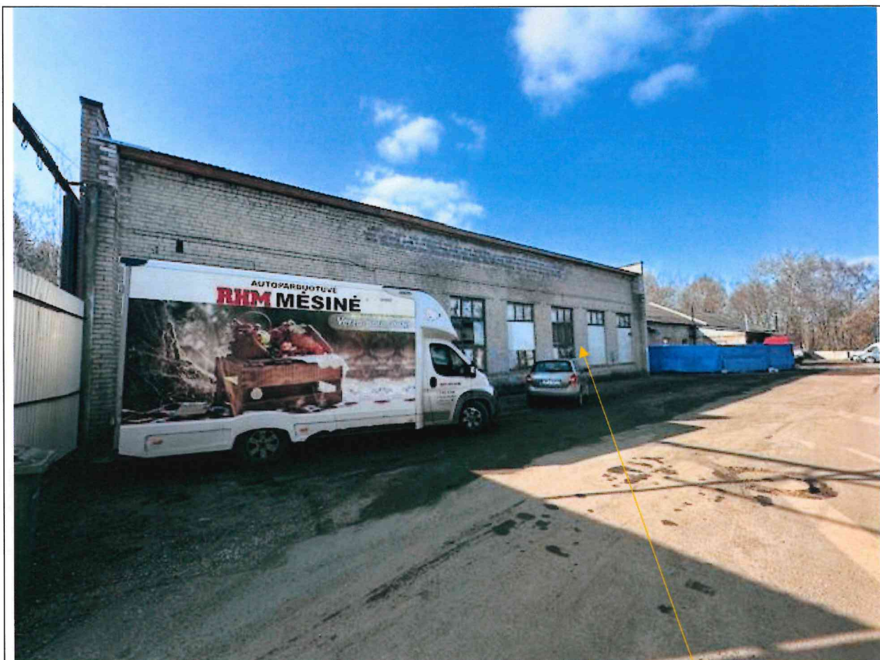
Foto lentelės prie 2026 m. kovo 31 d. patikrinimo akto Nr. ŽPa-28 tęsinys: (data) (registracijos numeris)

Nuotraukos Nr. 4 (eilės numeris ir aprašymas)