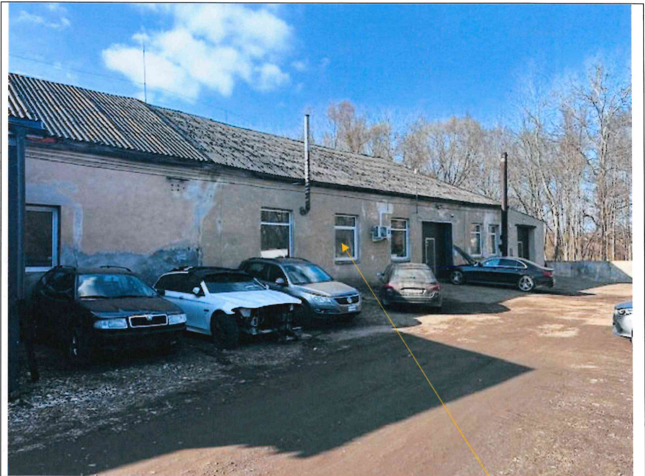
Foto lentelės prie 2026 m. kovo 31 d. patikrinimo akto Nr. ŽPa-28 tęsinys: (data) (registracijos numeris)

Nuotraukos Nr. 7 (eilės numeris ir aprašymas)