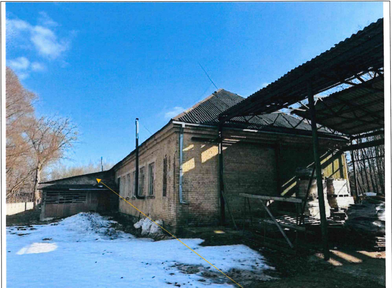
Foto lentelės prie 2026 m. kovo 31 d. patikrinimo akto Nr. ŽPa-28 tęsinys: (data) (registracijos numeris)

Nuotraukos Nr. 8 (eilės numeris ir aprašymas)