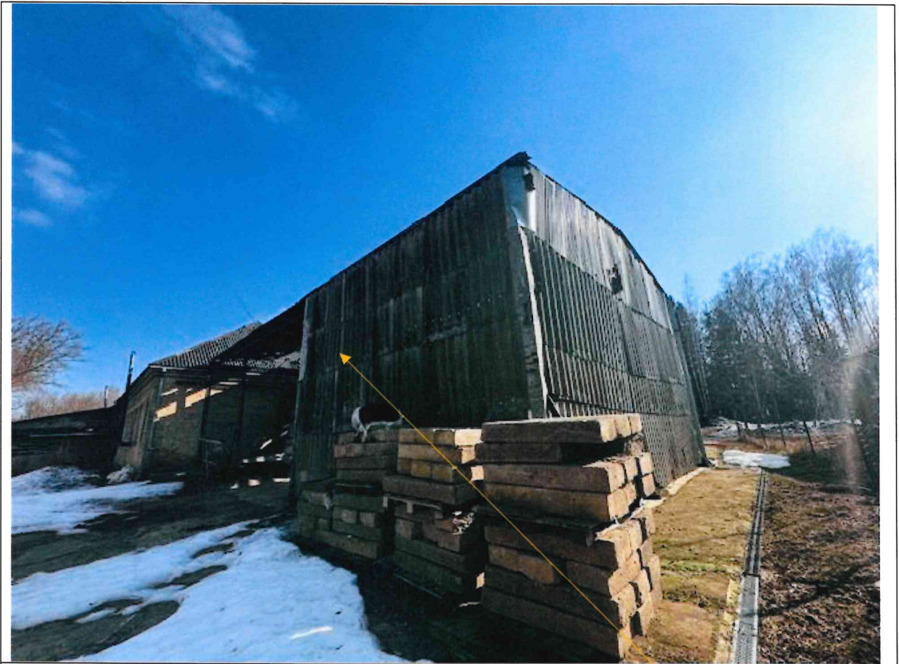
Foto lentelės prie 2026 m. kovo 31 d. patikrinimo akto Nr. ŽPa-28 tęsinys: (data) (registracijos numeris)

Nuotraukos Nr. 9 (eilės numeris ir aprašymas)