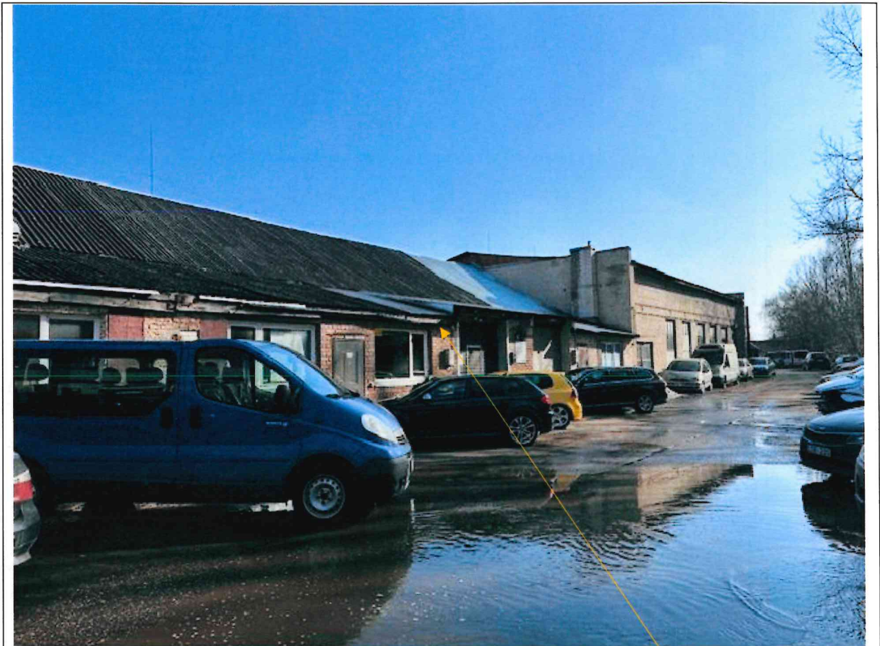
Foto lentelės prie 2026 m. kovo 31 d. patikrinimo akto Nr. ŽPa-28 tęsinys: (data) (registracijos numeris)

Nuotraukos Nr. 2 (eilės numeris ir aprašymas)