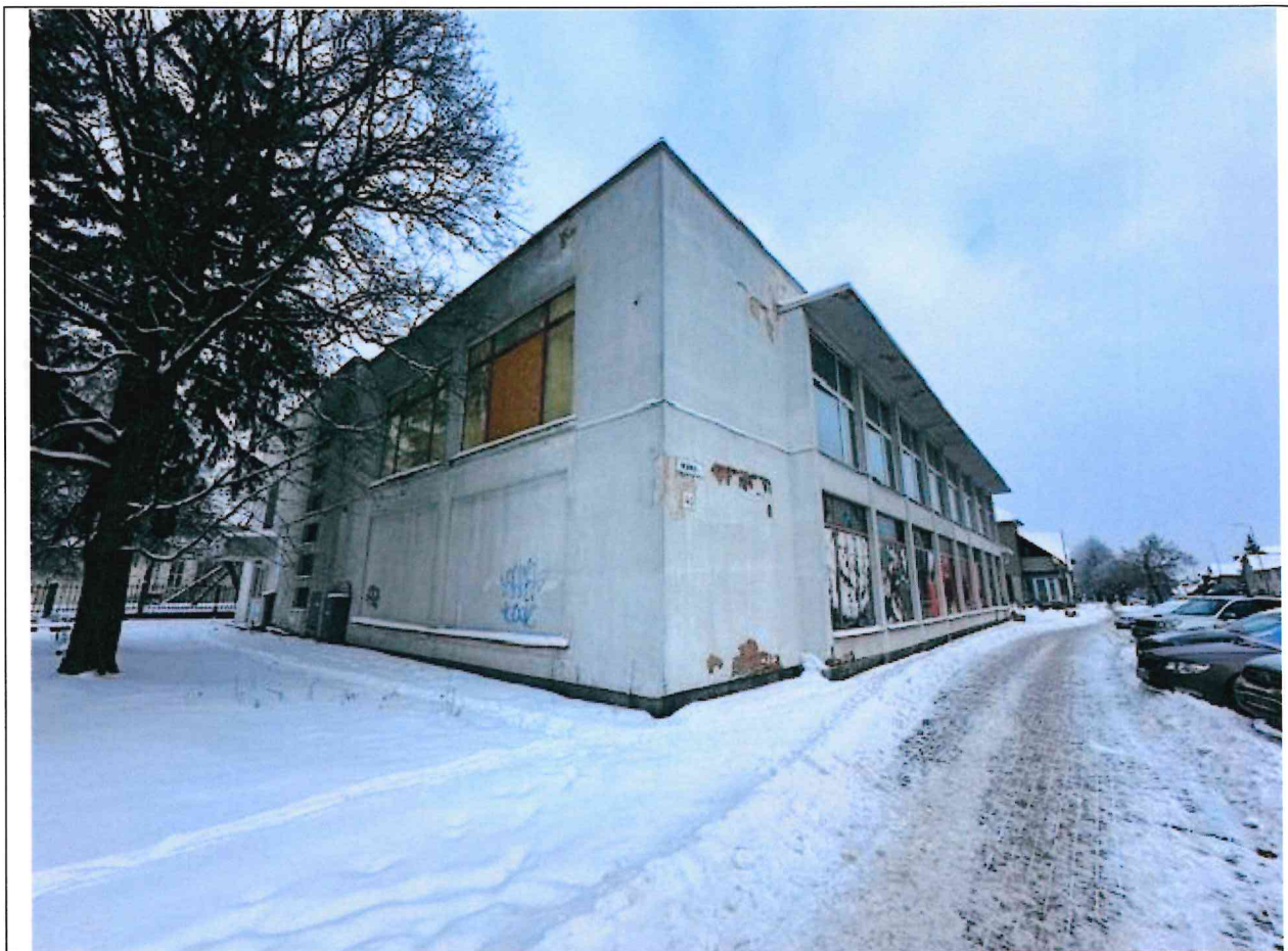
Foto lentelės prie 2026 m. sausio 13 d. patikrinimo akto Nr. ŽPa-3 tęsinys: ( data) (registracijos numeris)

Nuotraukos Nr. 2 (eilės numeris ir aprašymas)