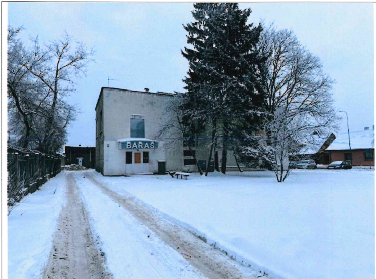
Foto lentelės prie 2026 m. sausio 13 d. patikrinimo akto Nr. ŽPa-3 tęsinys: ( data) (registracijos numeris)

Nuotraukos Nr. 3 (eilės numeris ir aprašymas)