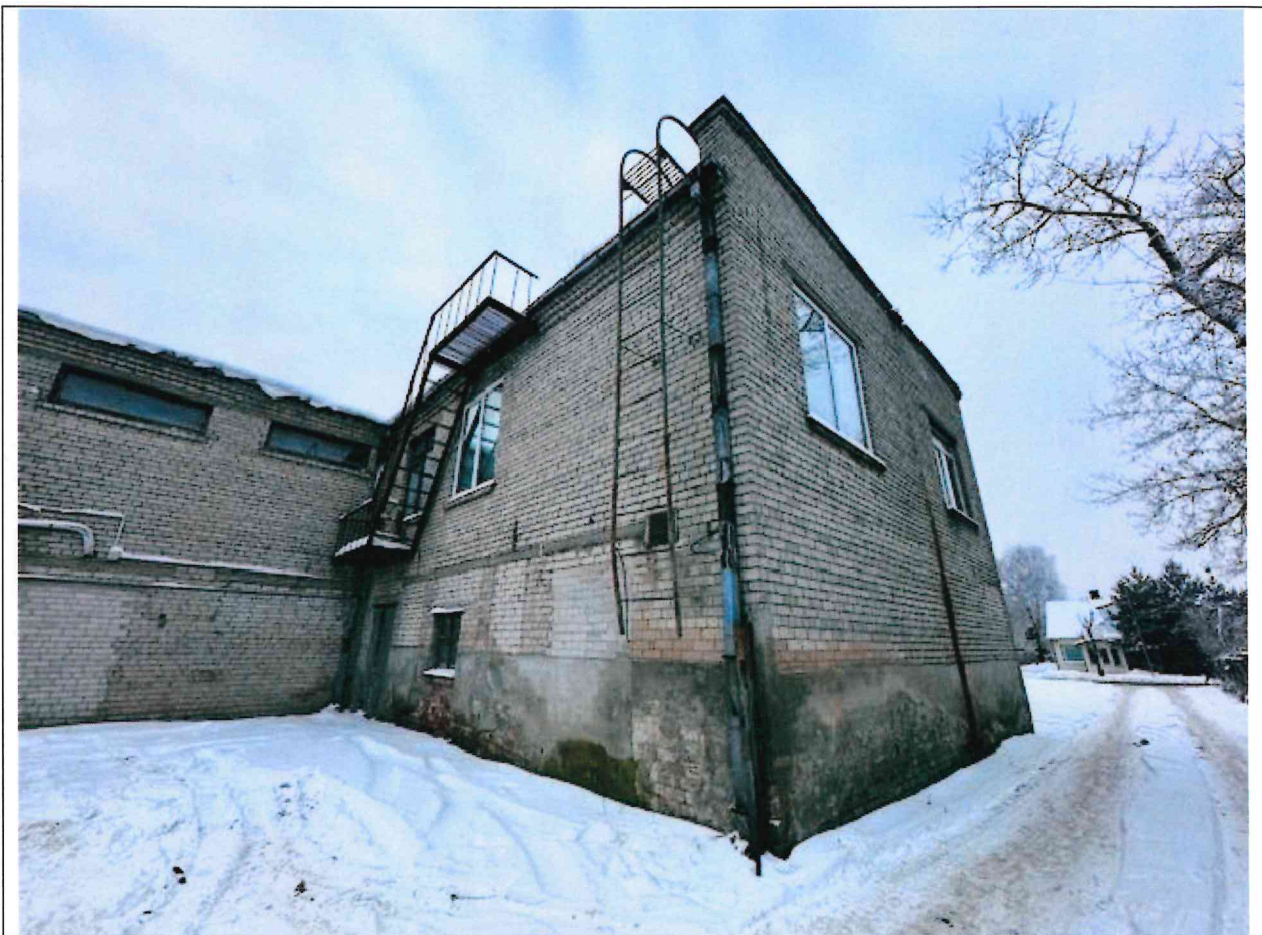
Foto lentelės prie 2026 m. sausio 13 d. patikrinimo akto Nr. ŽPa-3 tęsinys: ( data) (registracijos numeris)

Nuotraukos Nr. 6 (eilės numeris ir aprašymas)