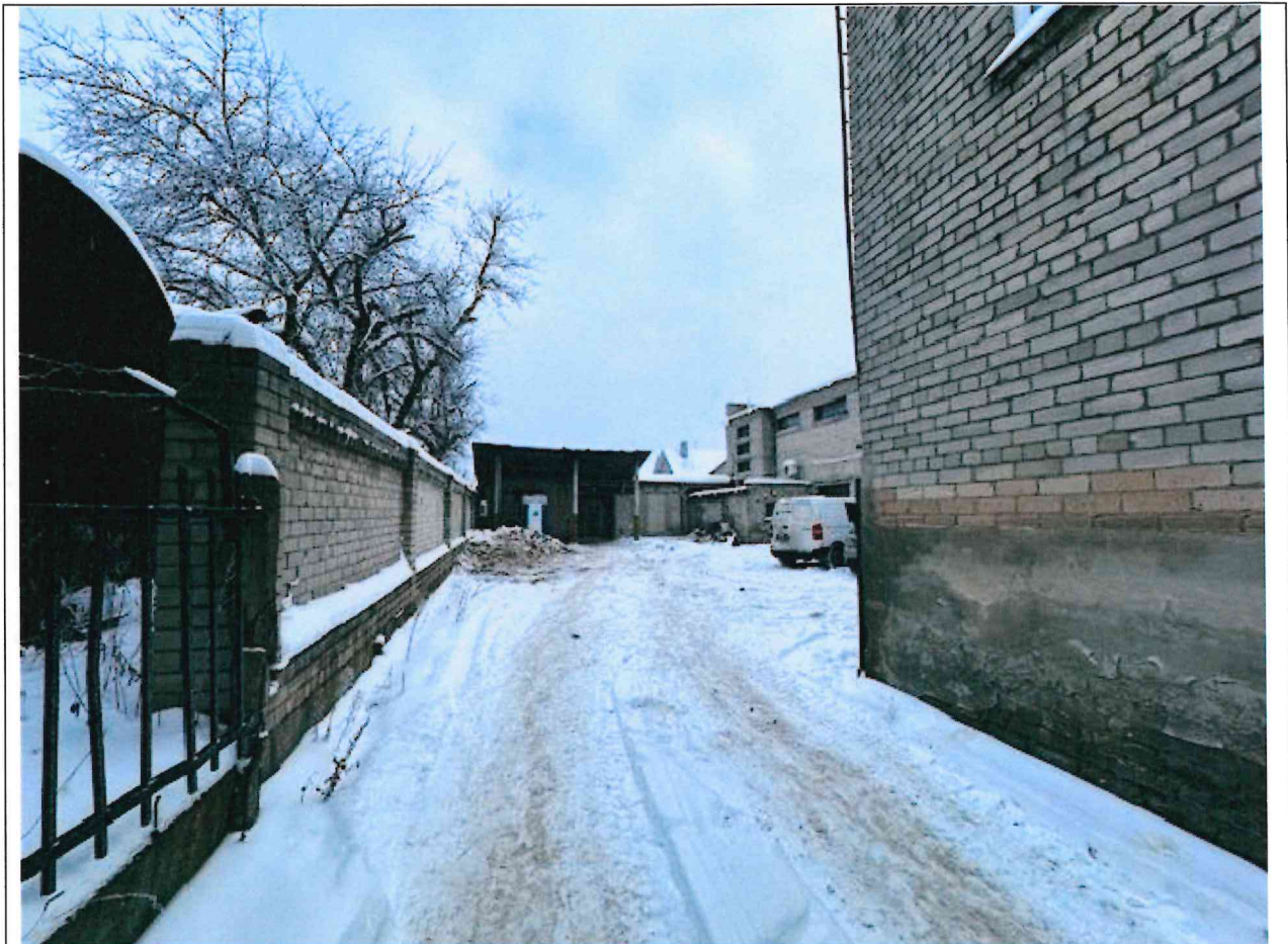
Foto lentelės prie 2026 m. sausio 13 d. patikrinimo akto Nr. ŽPa-3 tęsinys: ( data) (registracijos numeris)

Nuotraukos Nr. 4 (eilės numeris ir aprašymas)