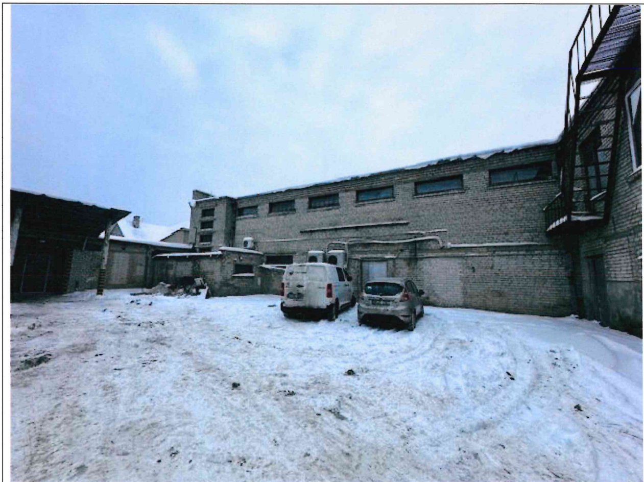
Foto lentelės prie 2026 m. sausio 13 d. patikrinimo akto Nr. ŽPa-3 tęsinys: ( data) (registracijos numeris)

Nuotraukos Nr. 5 (eilės numeris ir aprašymas)