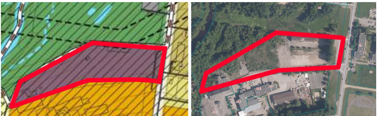
3 pav. Sprendinių ir esamos situacijos palyginamoji schema.

Faktinė teritorijos situacija atitinka Bendrojo plano sprendinių grafines dalies Pagrindiniame žemės naudojimo ir apsaugos reglamentų brėžinyje pavaizduotą Pramonės ir sandėliavimo zoną. Teritorijos ribos apytiksliai atitinka Savitiškio g. 10, Panevėžys, žemės sklypą, kuriame ortofotografiniame žemėlapyje matoma pramoninės ir/ar sandėliavimo paskirties pastatai, dideli išbetonuoti paviršiai (žr. 3 pav.)