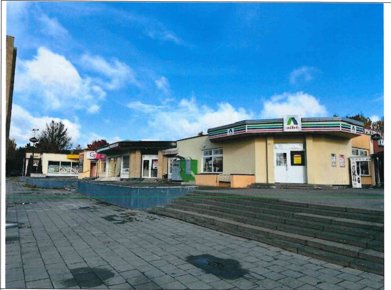
Foto lentelės prie 2025 m. spalio 20 d. patikrinimo akto Nr. ŽPa-69 tęsinys:

Nuotraukos Nr. 5 (eilės numeris ir aprašymas)