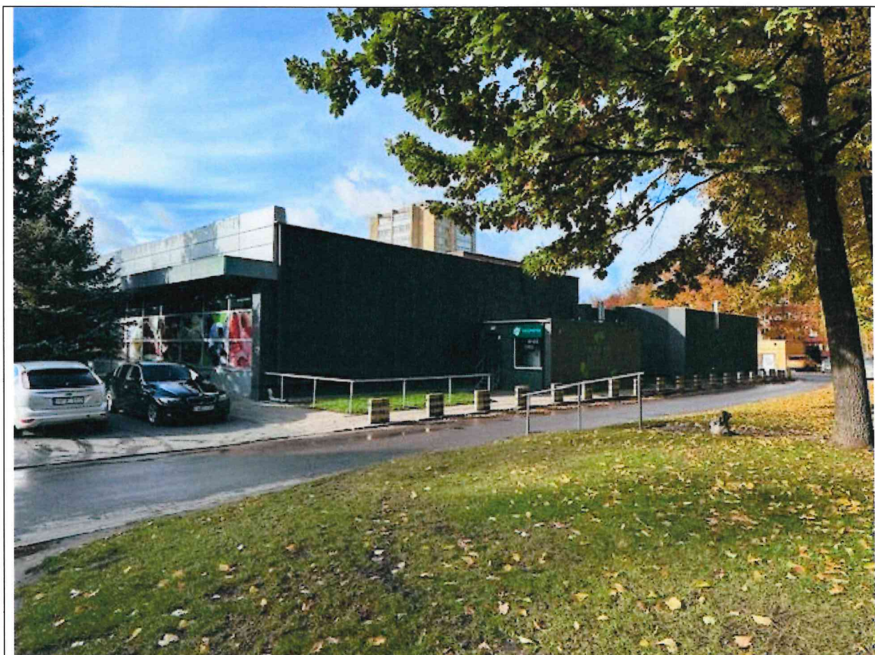
Foto lentelės prie 2025 m. spalio 20 d. patikrinimo akto Nr. ŽPa-69 tęsinys:

Nuotraukos Nr. 2 (eilės numeris ir aprašymas)