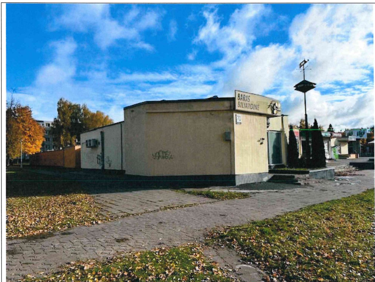
Foto lentelės prie 2025 m. spalio 20 d. patikrinimo akto Nr. ŽPa-69 tęsinys:

Nuotraukos Nr. 4 (eilės numeris ir aprašymas)