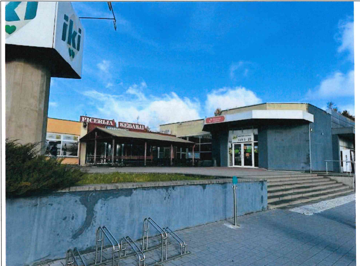
Foto lentelės prie 2025 m. spalio 20 d. patikrinimo akto Nr. ŽPa-69 tęsinys:

Nuotraukos Nr. 6 (eilės numeris ir aprašymas)