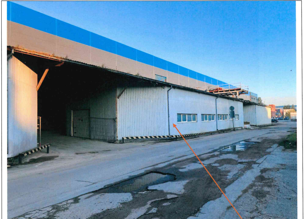
Foto lentelės prie 2025 m. spalio 8 d. patikrinimo akto Nr. ŽPa-61 tęsinys:

Nuotraukos Nr. 6 (eilės numeris ir aprašymas)