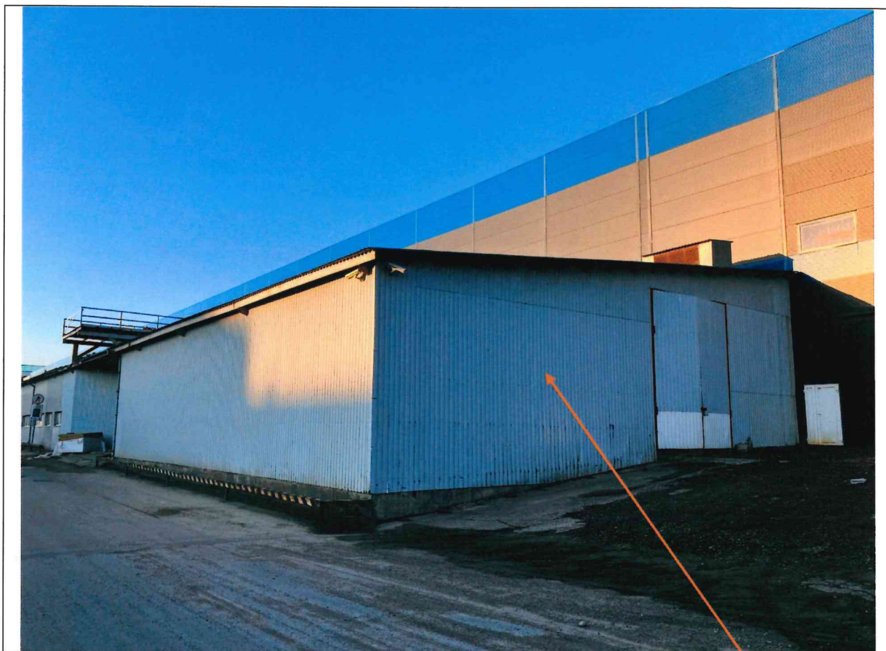
Foto lentelės prie 2025 m. spalio 8 d. patikrinimo akto Nr. ŽPa-61 tęsinys:

Nuotraukos Nr. 5 (eilės numeris ir aprašymas)