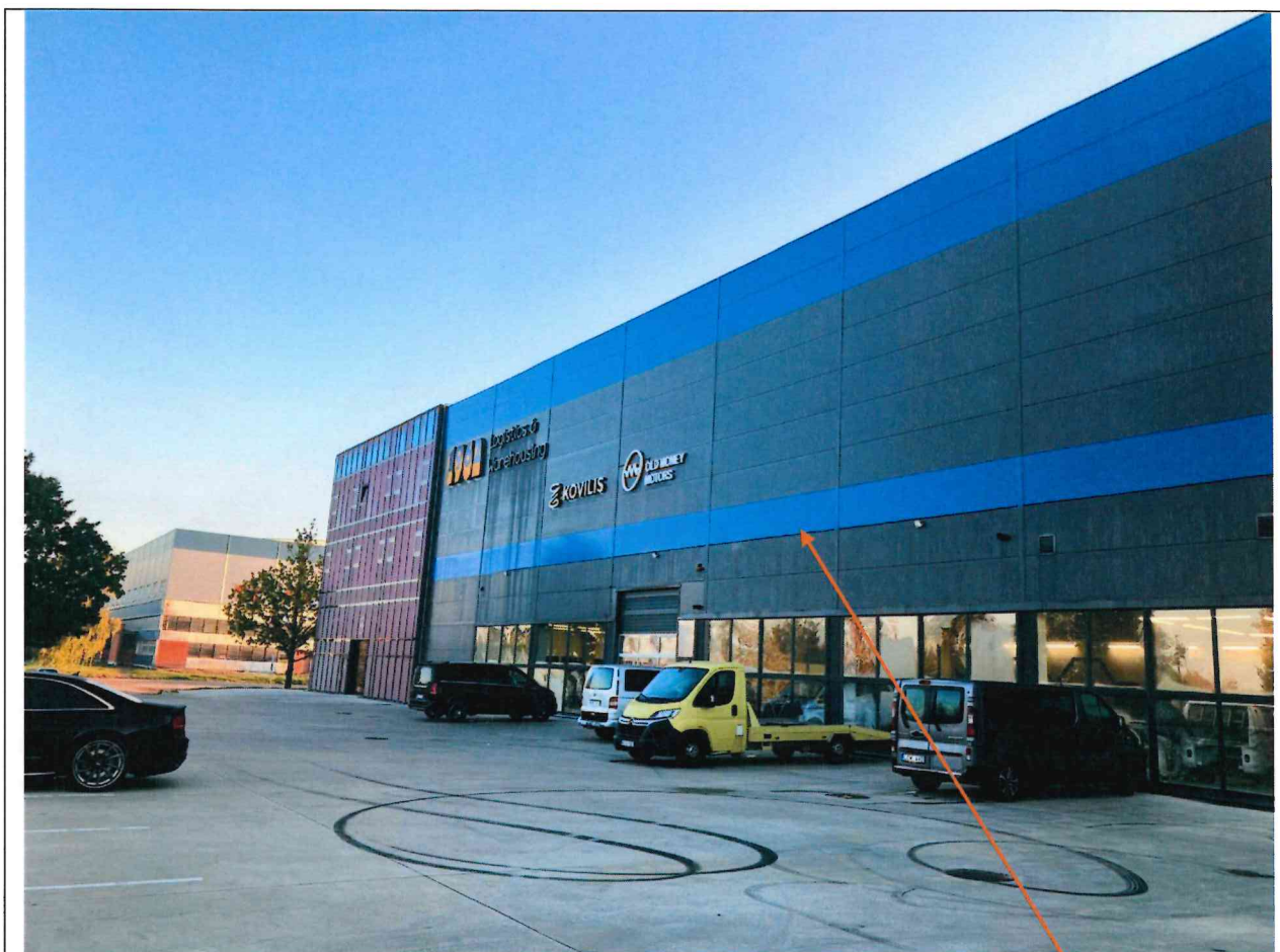
Foto lentelės prie 2025 m. spalio 8 d. patikrinimo akto Nr. ŽPa-61 tęsinys:

Nuotraukos Nr. 2 (eilės numeris ir aprašymas)