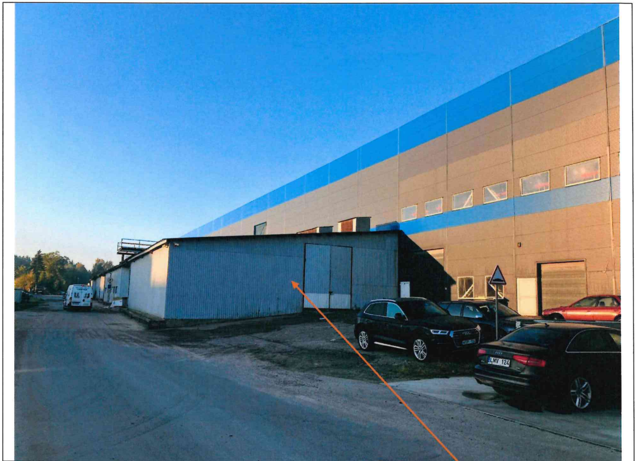
Foto lentelės prie 2025 m. spalio 8 d. patikrinimo akto Nr. ŽPa-61 tęsinys:

Nuotraukos Nr. 4 (eilės numeris ir aprašymas)