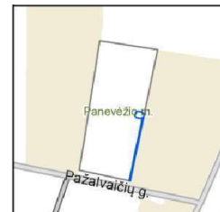
Apsaugos zonos išdėstymo schema