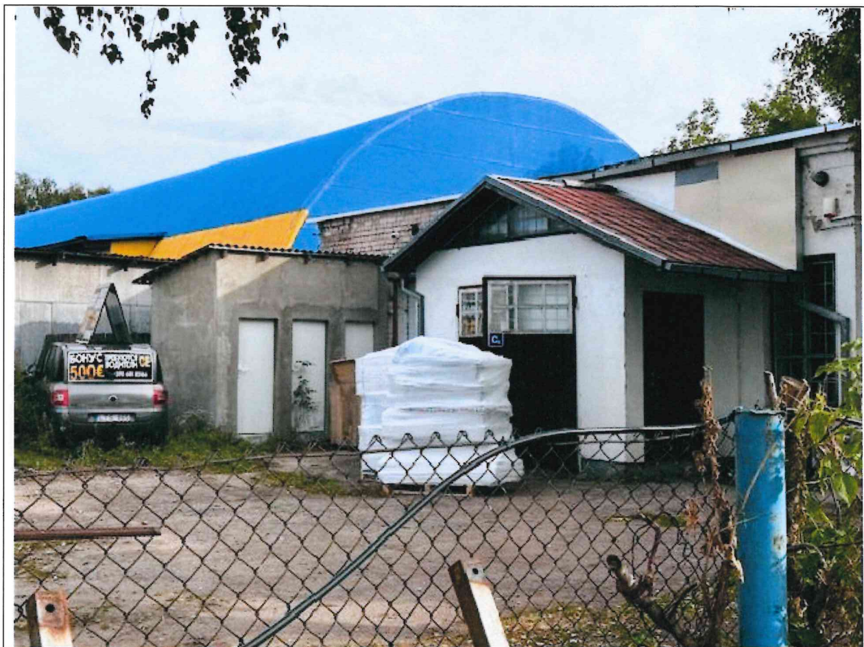
Foto lentelės prie 2025 m. rugsėjo 26 d. patikrinimo akto Nr. ŽPa-59 tęsinys:

Nuotraukos Nr. 5 (penktas) (eilės numeris ir aprašymas)