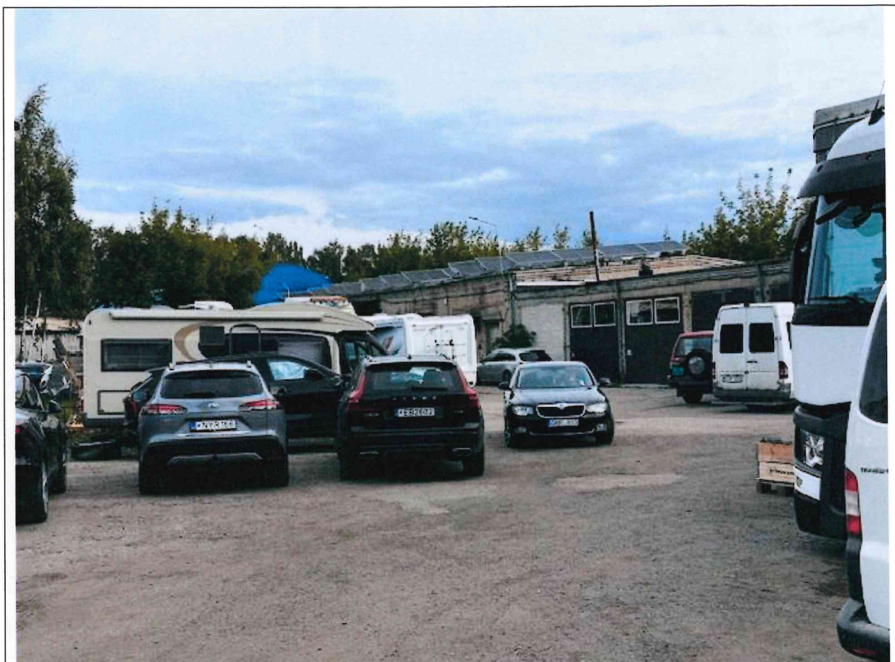
Foto lentelės prie 2025 m. rugsėjo 26 d. patikrinimo akto Nr. ŽPa-59 tęsinys:

Nuotraukos Nr. 4 ( ketvirtas ) (eilės numeris ir aprašymas)