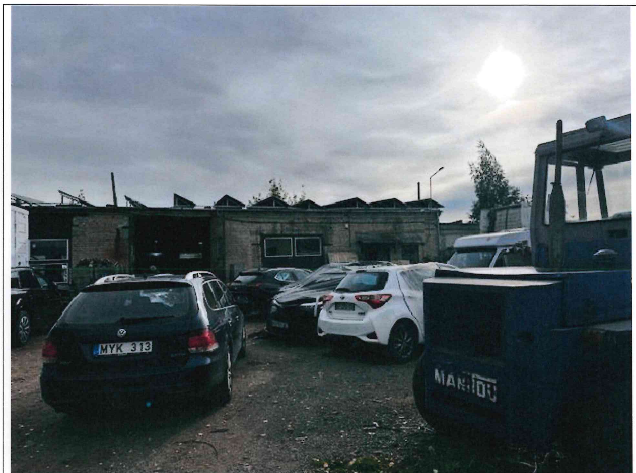
Foto lentelės prie 2025 m. rugsėjo 26 d. patikrinimo akto Nr. ŽPa-59 tęsinys:

Nuotraukos Nr. 3 (trečias) (eilės numeris ir aprašymas)