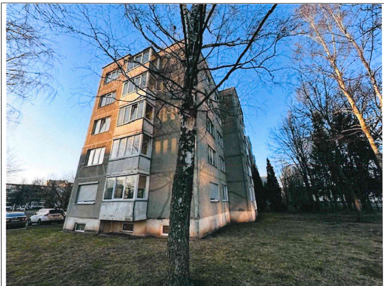
Foto lentelės prie 2025 m. kovo 17 d. patikrinimo akto Nr. ŽPa-20 tęsinys: (data) (registracijos numeris)

Nuotraukos Nr. 2 (antras) (eilės numeris ir aprašymas)