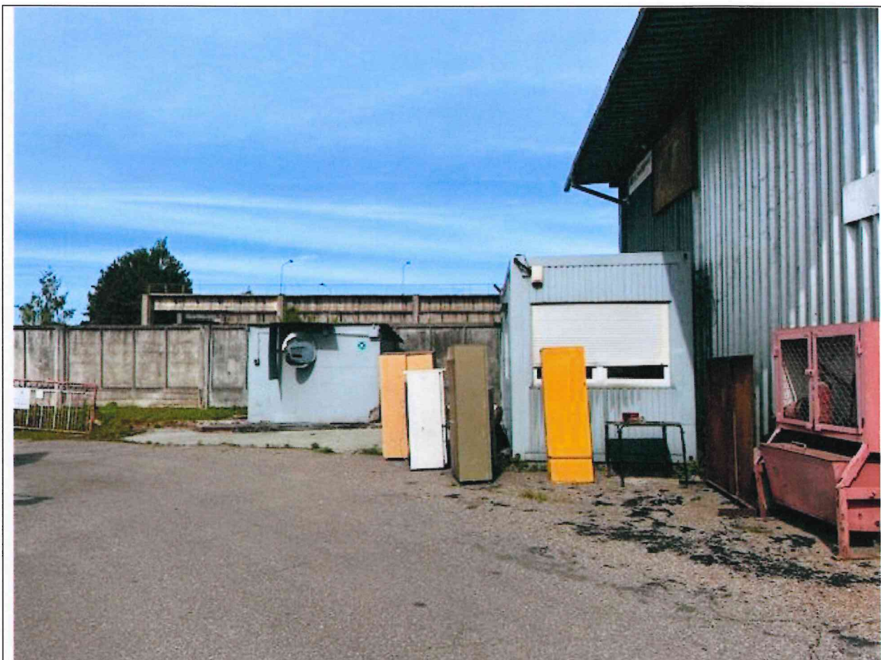
Foto lentelės prie 2025 m. birželio 16 d. patikrinimo akto Nr. ŽPa-36 tęsinys:

Nuotraukos Nr. 8 (aštuntas) (eilės numeris ir aprašymas)