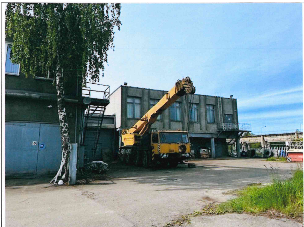
Foto lentelės prie 2025 m. birželio 16 d. patikrinimo akto Nr. ŽPa-36 tęsinys:

Nuotraukos Nr. 4 (ketvirtas) (eilės numeris ir aprašymas)