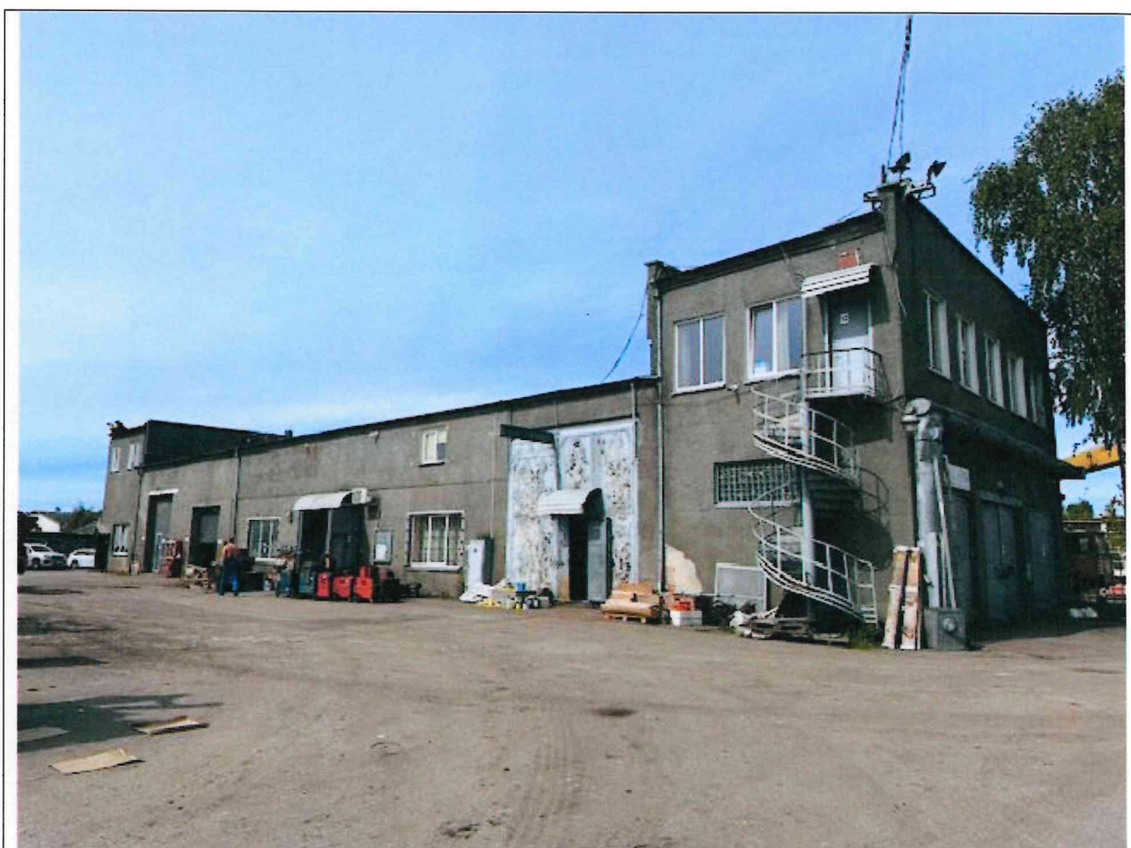
Foto lentelės prie 2025 m. birželio 16 d. patikrinimo akto Nr. ŽPa-36 tęsinys:

Nuotraukos Nr. 3 (trečias) (eilės numeris ir aprašymas)