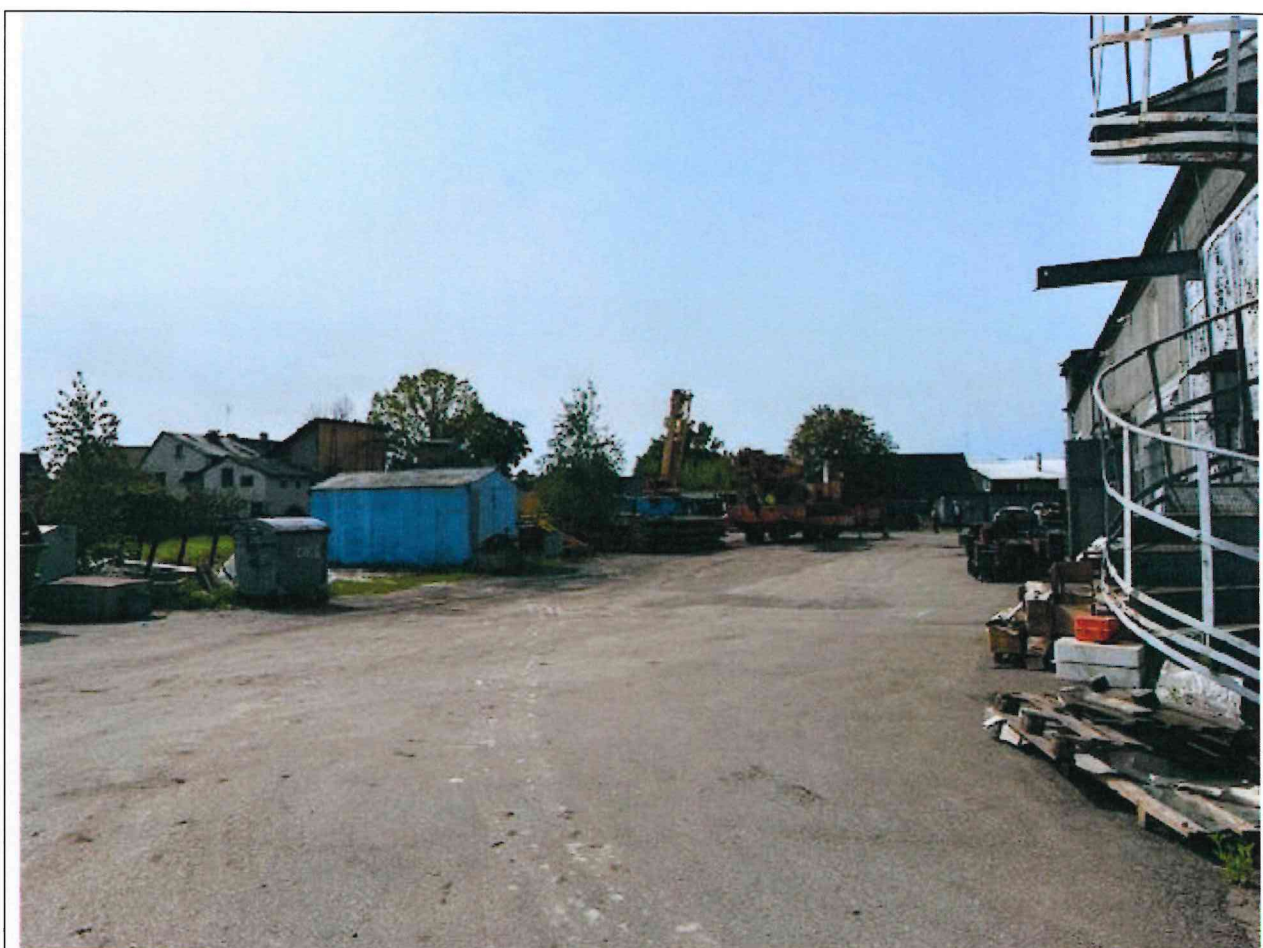
Foto lentelės prie 2025 m. birželio 16 d. patikrinimo akto Nr. ŽPa-36 tęsinys:

Nuotraukos Nr. 5 (penktas) (eilės numeris ir aprašymas)