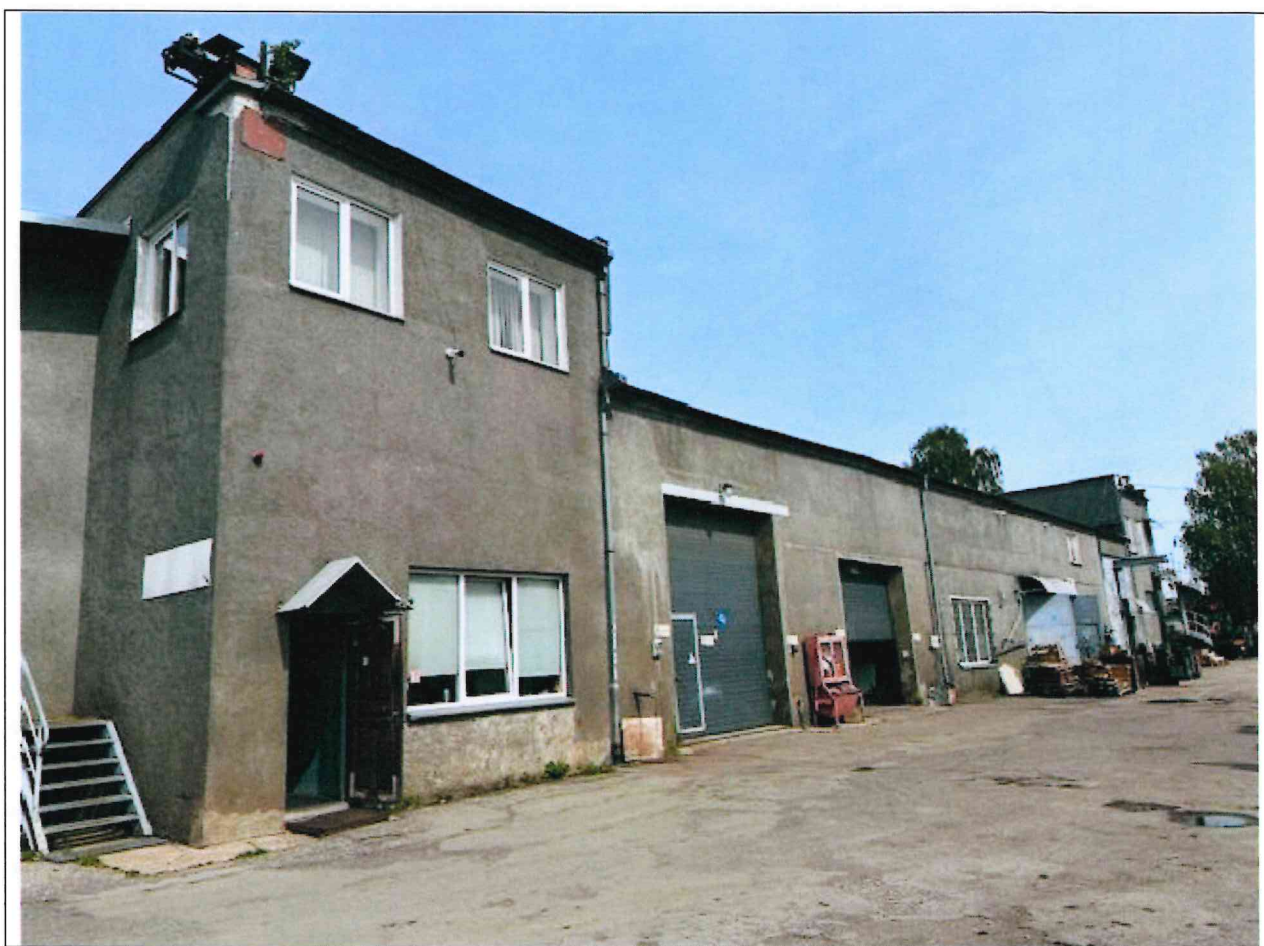
Foto lentelės prie 2025 m. birželio 16 d. patikrinimo akto Nr. ŽPa-36 tęsinys:

Nuotraukos Nr. 2 (antras) (eilės numeris ir aprašymas)