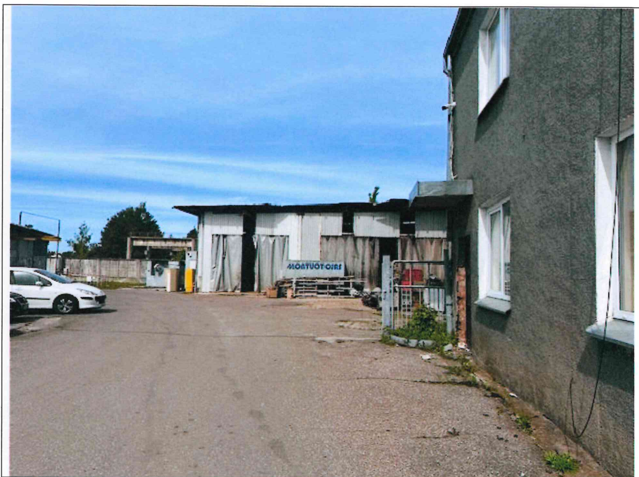
Foto lentelės prie 2025 m. birželio 16 d. patikrinimo akto Nr. ŽPa-36 tęsinys:

Nuotraukos Nr. 7 (septintas) (eilės numeris ir aprašymas)