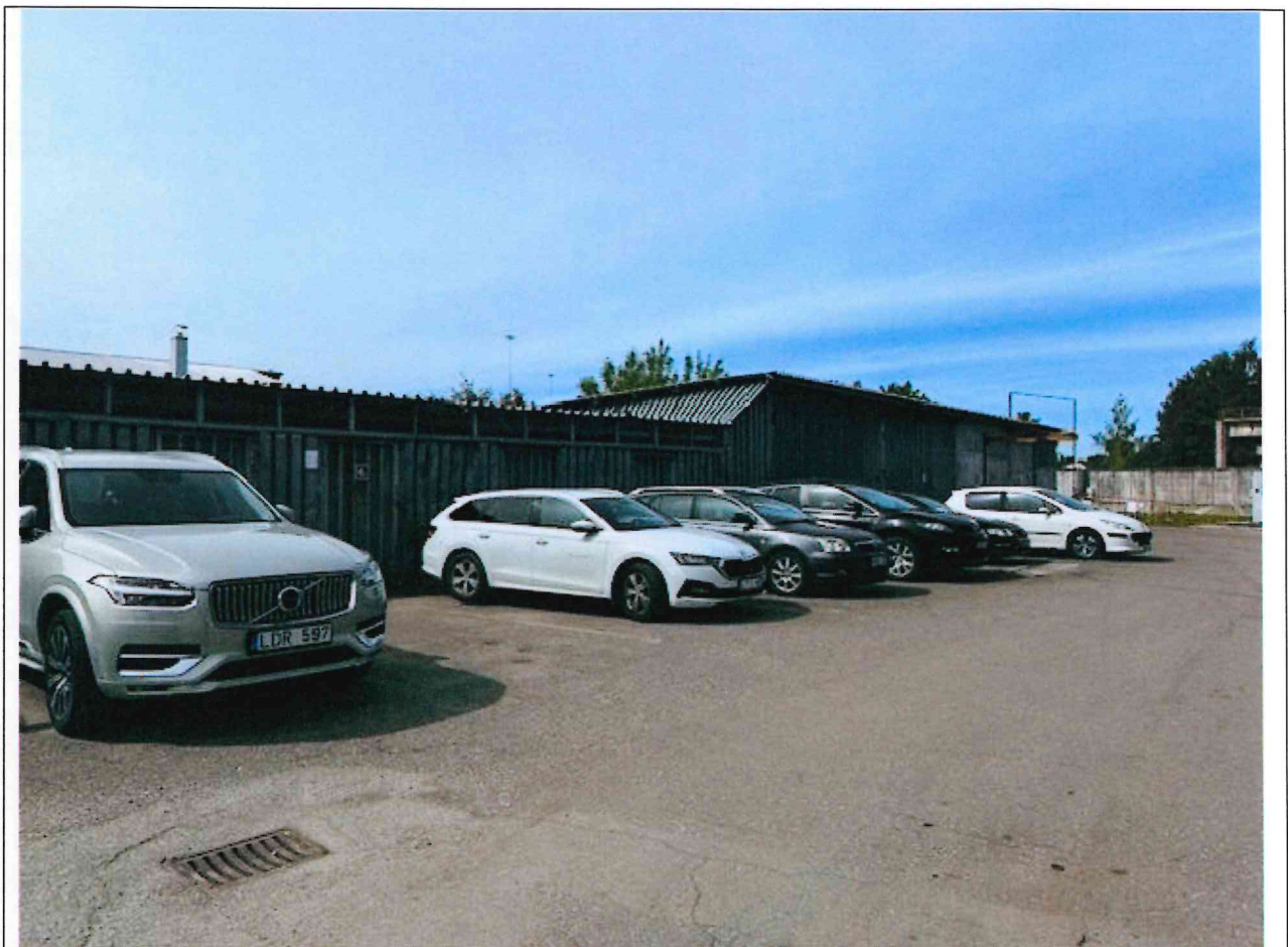
Foto lentelės prie 2025 m. birželio 16 d. patikrinimo akto Nr. ŽPa-36 tęsinys:

Nuotraukos Nr. 6 (šeštas) (eilės numeris ir aprašymas)