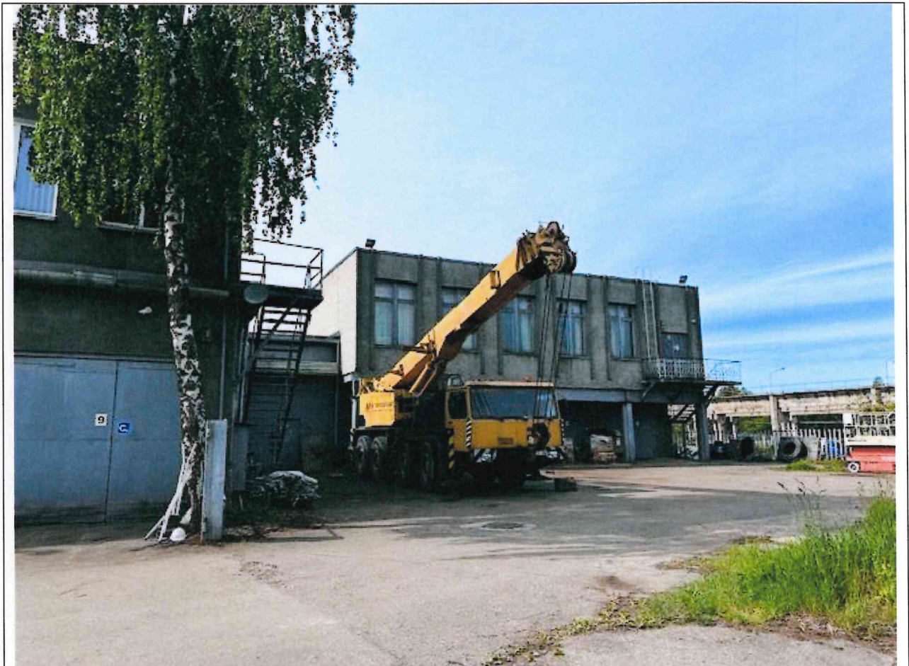
Foto lentelės prie 2025 m. gegužės 27 d. patikrinimo akto Nr. ŽPa-31 tęsinys:

Nuotraukos Nr. 4 (ketvirtas) (eilės numeris ir aprašymas)