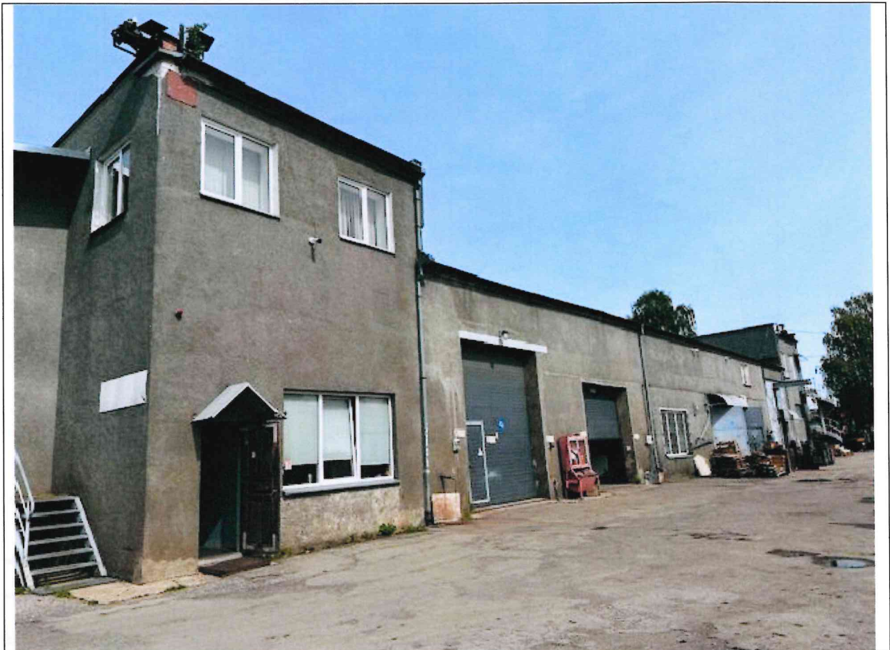
Foto lentelės prie 2025 m. gegužės 27 d. patikrinimo akto Nr. ŽPa-31 tęsinys:

Nuotraukos Nr. 2 (antras) (eilės numeris ir aprašymas)