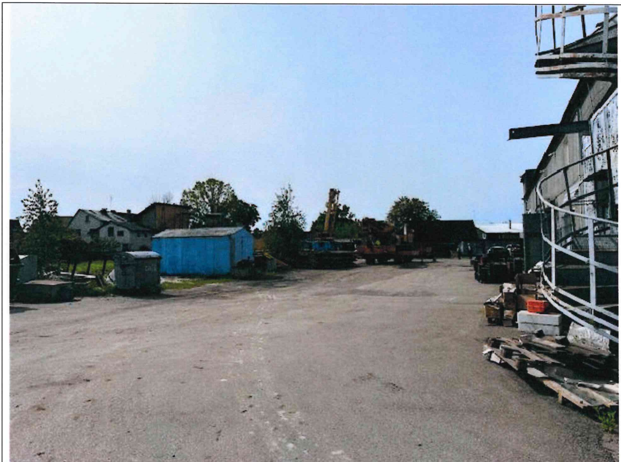
Foto lentelės prie 2025 m. gegužės 27 d. patikrinimo akto Nr. ŽPa-31 tęsinys:

Nuotraukos Nr. 5 (penktas) (eilės numeris ir aprašymas)