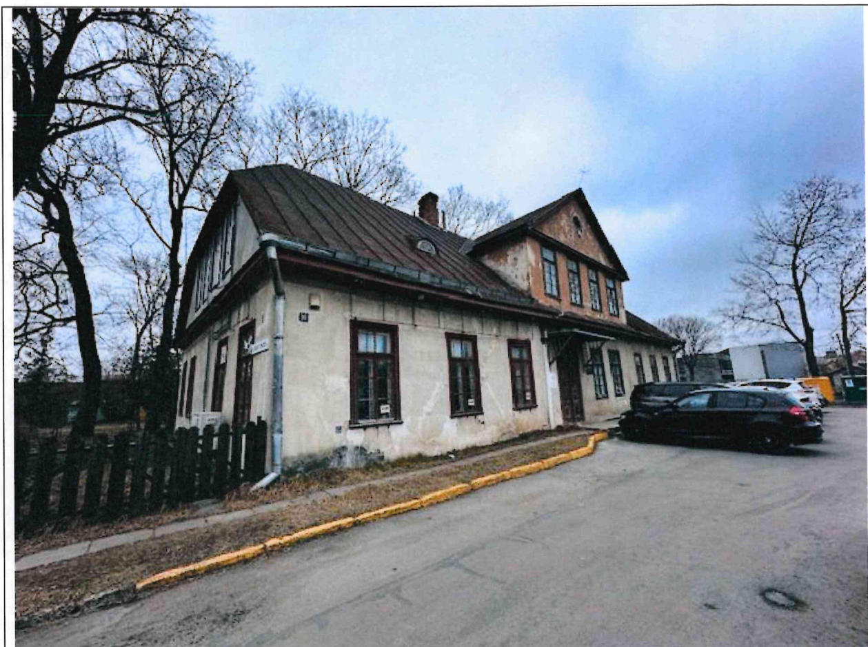
Foto lentelės prie 2025 m. kovo 20 d. patikrinimo akto Nr. ŽPa-21 tęsinys:

Nuotraukos Nr. 2 (antras) (eilės numeris ir aprašymas)