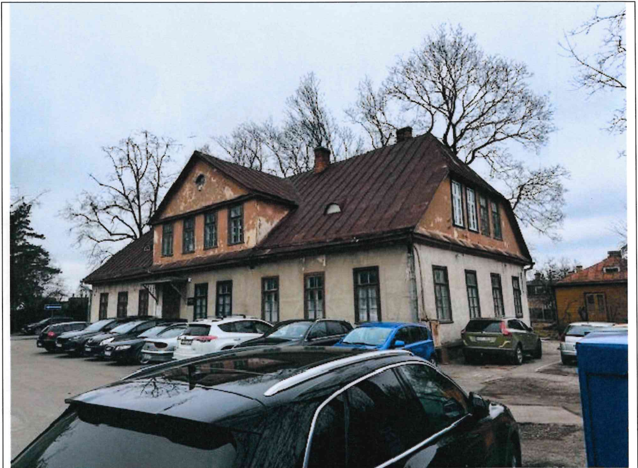
Foto lentelės prie 2025 m. kovo 20 d. patikrinimo akto Nr. ŽPa-21 tęsinys:

Nuotraukos Nr. 4 (ketvirtas) (eilės numeris ir aprašymas)