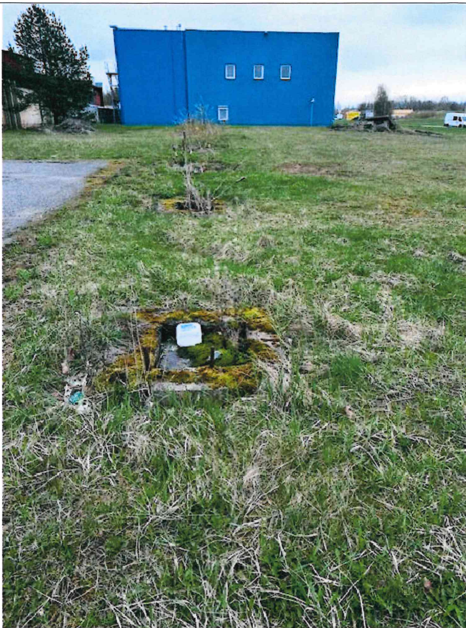
Nuotraukos Nr. 2 (antras) (eilės numeris ir aprašymas)

Sudarė: vyriausioji specialistė Donata Maskalioviene (darbuotojo pareigos, vardas, pavardė)