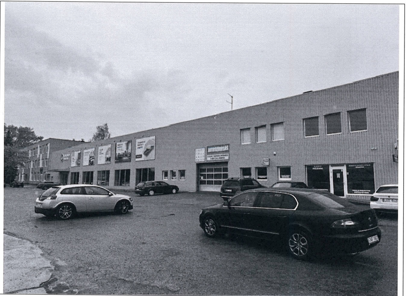
Foto lentelės prie 2024 m. gegužės 10 d. patikrinimo akto Nr. ŽPa-31 tęsinys:

Nuotraukos Nr. 2 (antras) (eilės numeris ir aprašymas)