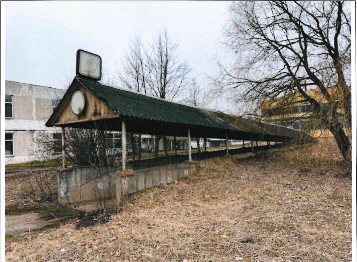
Foto lentelės prie 2024 m. kovo 19 d. patikrinimo akto Nr. ŽPa- 1(18.31 E) tęsinys:

Nuotraukos Nr. 2 (antras) (eilės numeris ir aprašymas)