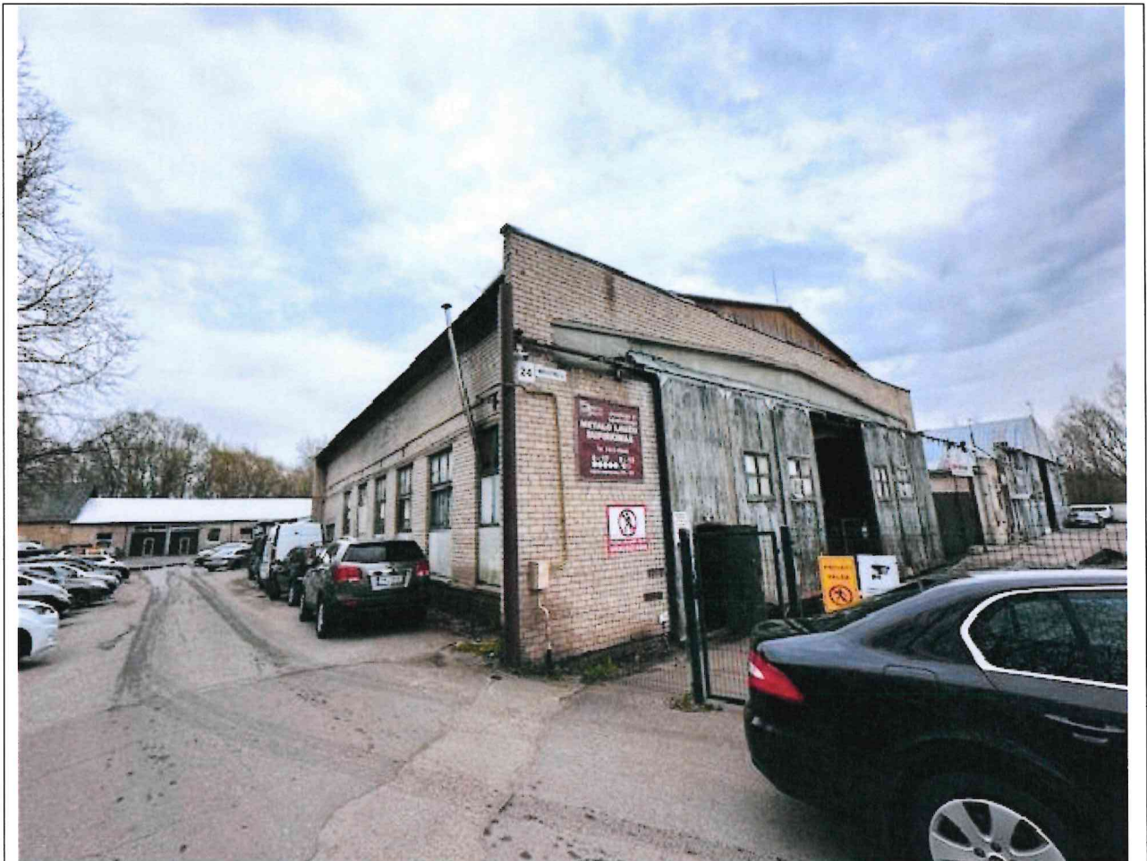
Nuotraukos Nr. 3 (trečias) (eilės numeris ir aprašymas)

Sudarė: vyriausioji specialistė Donata Maskalioviene (darbuotojo pareigos, vardas, pavardė)