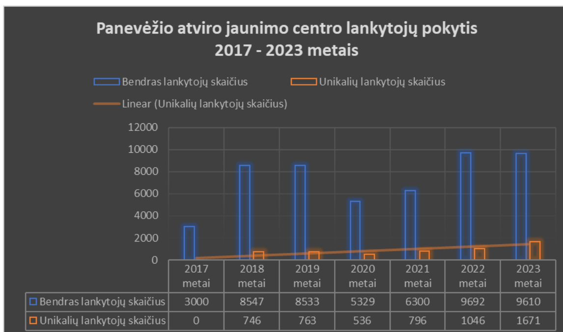
1 lentelė – jaunuolių apsilankymų PAJC pokytis 2017- 2023 metais

Vieno jaunuolio apsilankymo atviraime jaunimo centre kaina – 27,44 euro.