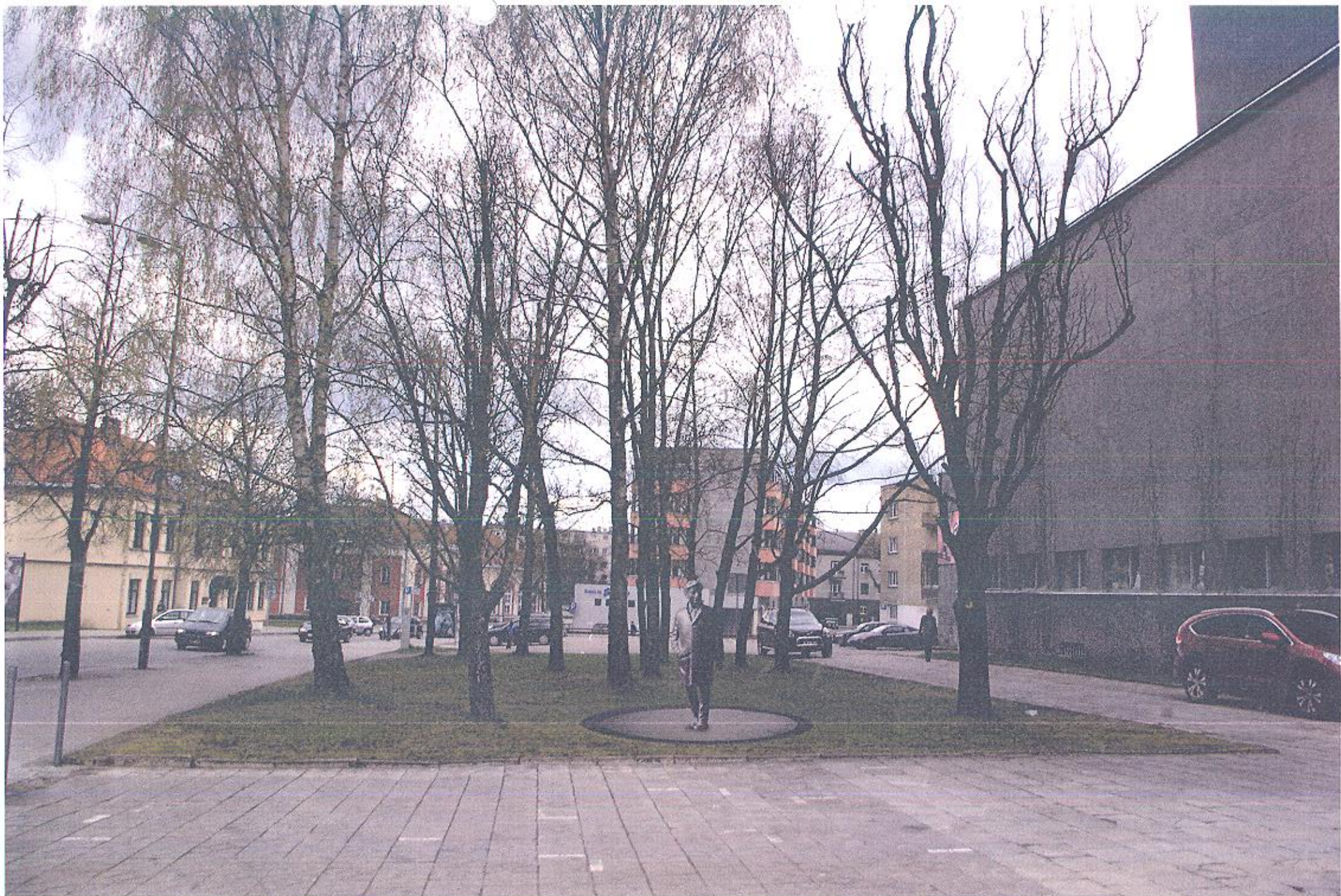
OMNIDT PANNUNDE WILKID