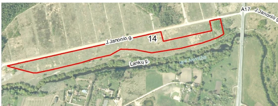
Planuojama teritorija ir jos numeris (www.maps.lt)