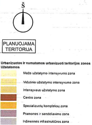
Planuojamos teritorijos situacija Panevėžio miesto teritorijos bendrojo plano keitimo Pagrindiniame žemės naudojimo ir apsaugos reglamentų brėžinyje