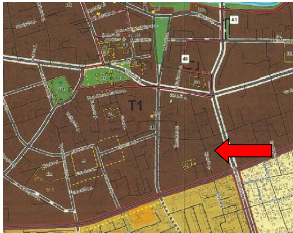
Pagrindinis žemės naudojimo ir apsaugos reglamentų brėžinys