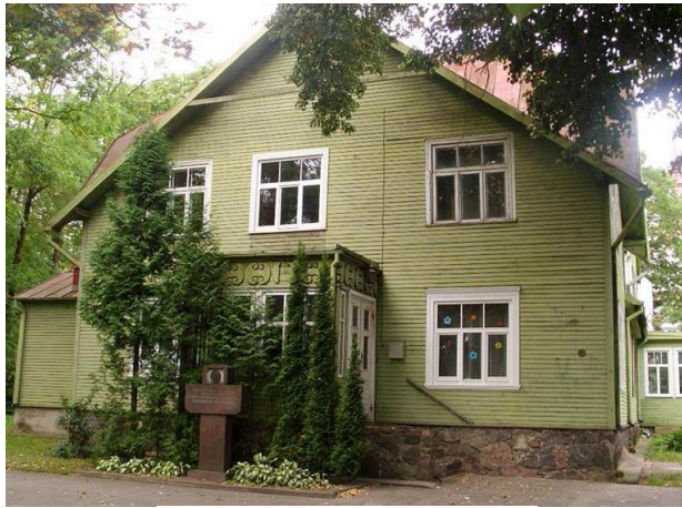
Pastatas adresu Sodų g. 3, Panevėžio m.

Formuojamas sklypas patenka į kultūros paveldo teritoriją (unikalus objekto kodas 21650). Minėtoje teritorijoje stovi pastatas adresu Panevėžio miesto sav., Panevėžio m., Sodų g. 3, kuriame 1926-1949 m. gyveno ir dirbo pirmasis Panevėžio vyskupijos vyskupas ir švietėjas Kazimieras Paltarokas.