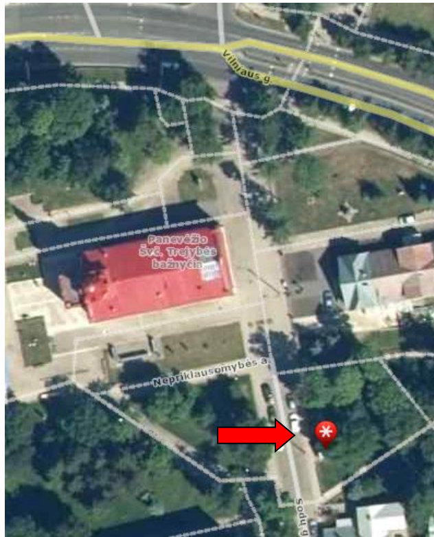
Žemės sklypo projekto rengimo vieta

Formuojamas žemės sklypas yra Panevėžio m. (2701/0023) kadastro vietovėje, adresu Nepriklausomybės a. 10, 35209 Panevėžys, Panevėžio m. sav.