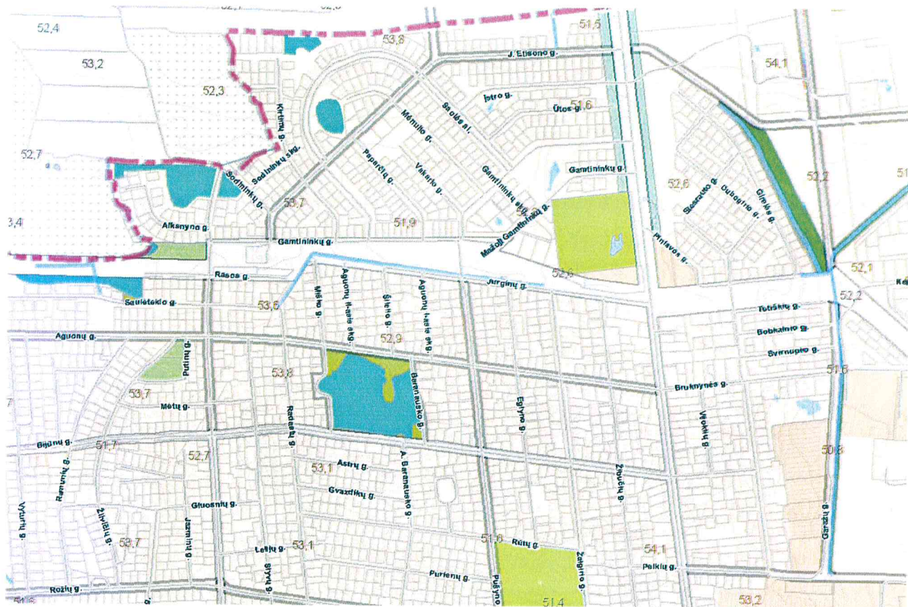
2 pav. Formuojamo žemės sklypo vieta Panevėžio mieste (ištrauka iš Panevėžio miesto bendrojo plano sprendinių. Gamtinis karkasas ir bendro naudojimo bei rekreacijos teritorijų plėtra).