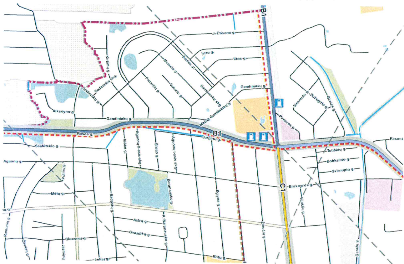
3 pav. Formuojamo žemės sklypo vieta Panevėžio mieste (ištrauka iš Panevėžio miesto bendrojo plano sprendinių. Susisiekimo infrastruktūros brėžinys).