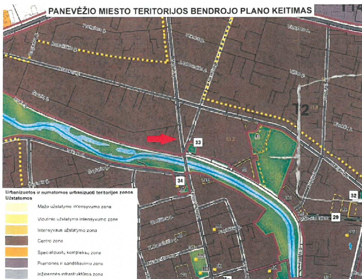
1 pav. Ištrauka iš Panevėžio miesto savivaldybės teritorijos bendrojo plano.