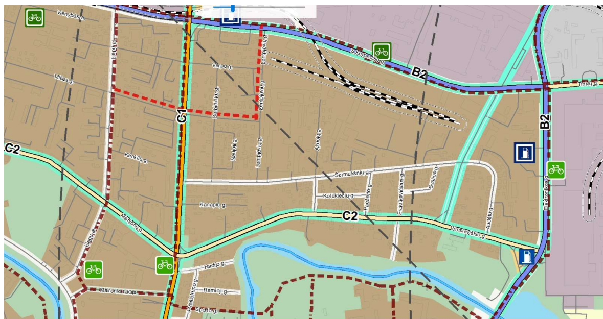
2 pav. Formuojamo žemės sklypo vieta Panevėžio mieste (ištrauka iš Panevėžio miesto teritorijos bendrojo plano sprendinių. Susisiekimo infrastruktūros brėžinys.)