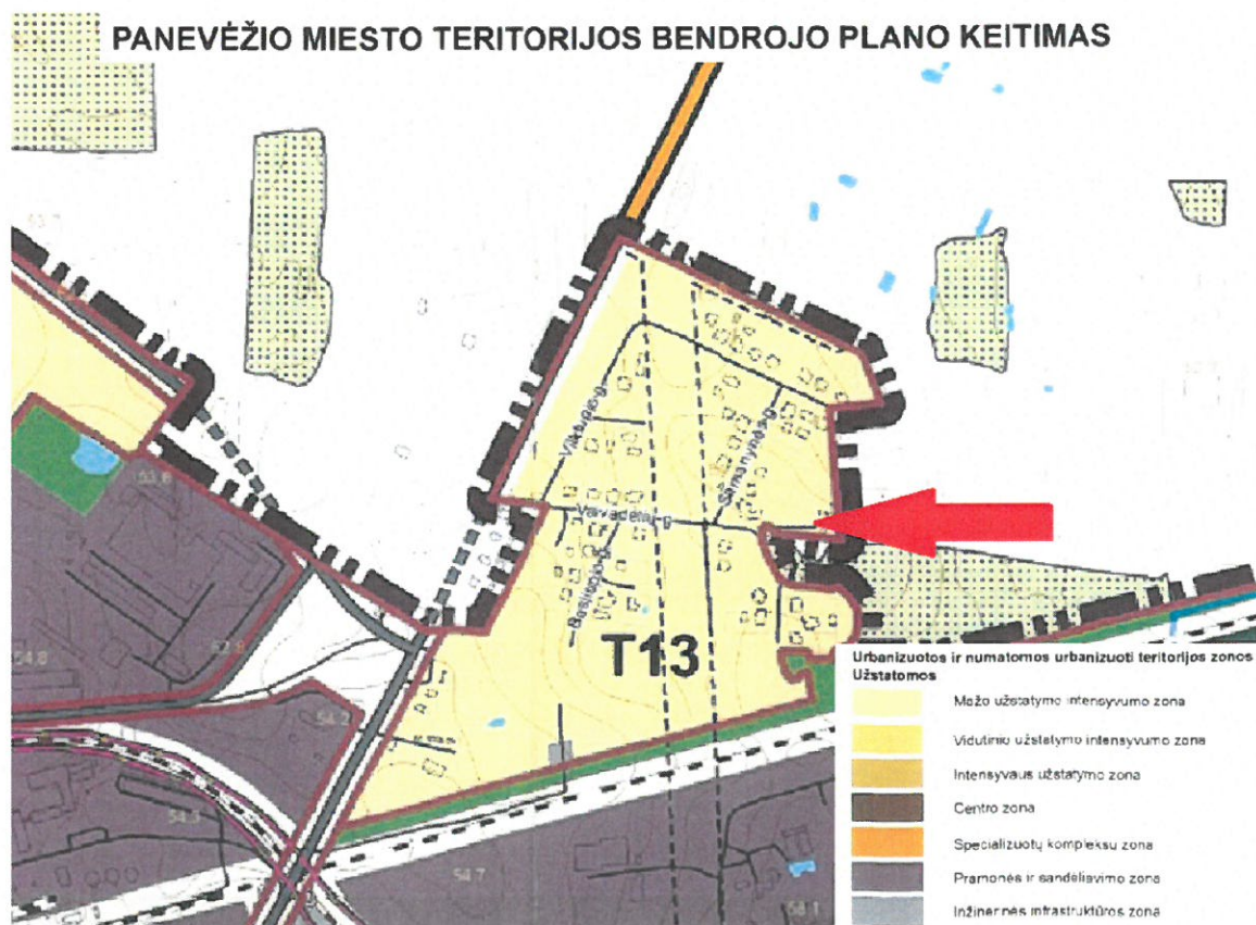
1 pav. Ištrauka iš Panevėžio miesto savivaldybės teritorijos bendrojo plano.