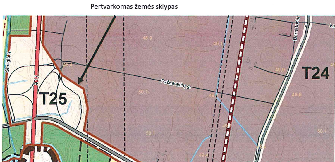
2 pav. Ištrauka iš Panevėžio miesto teritorijos bendrojo plano keitimo sprendinių pagrindinio žemės naudojimo ir apsaugos reglamentų brėžinio.

Pagal Panevėžio miesto bendrąjį planą žemės sklypas patenka T24 ir T25 teritorijas.