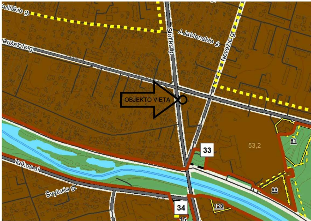
REGLAMENTŲ LENTELĖ Nagrinėjamų teritorijų užstatymo reglamentai (taikomi naujai statybai)