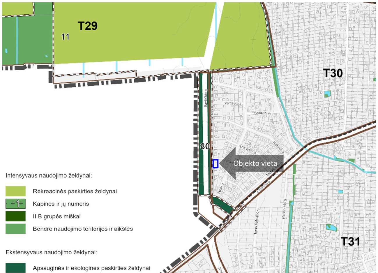
3 pav. Ištrauka iš Panevėžio miesto teritorijos bendrojo plano dalies „Gamtinis karkasas ir želdynų bei rekreacijos teritorijų plėtra“ koregavimo