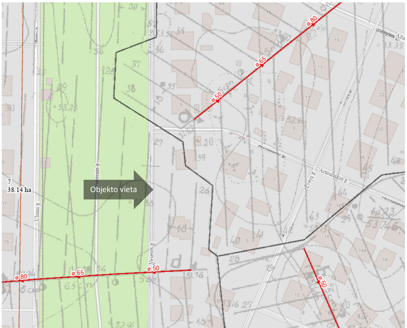
5 pav. Ištrauka iš Panevėžio rajono teritorijų planavimo žemėlapiu, melioracijos duomenys

Melioruotoje žemėje urbanizuotose ir (ar) urbanizuojamose teritorijose – išilgai drenažo rinktuvo esančioje žemės juostoje, kurios ribos yra po 2,5 metro į abi puses nuo bendrojo naudojimo drenažo rinktuvo ašinės linijos (išskyrus taršos šaltinius), o atsižvelgiant į žemės sklype įrengtus inžinerinius įrenginius ir suderinus su savivaldybės administracija, – išilgai drenažo rinktuvo esančioje žemės juostoje, kurios ribos yra po 1 metrą į abi puses nuo bendrojo naudojimo drenažo rinktuvo ašinės linijos (išskyrus taršos šaltinius) draudžiama: sodinti medžius ir (ar) krūmus; statyti statinius, įrengti įrenginius; įrengti nepratekamus dirbtinius vandens telkinius. Melioruotoje žemėje, Statybos įstatyme ar žemės ūkio ministro nustatyta tvarka negavus savivaldybės administracijos pritarimo projektui ar numatomai veiklai, draudžiama: vykdyti kasybos, statybos ir (ar) požeminius darbus didesniame kaip 0,7 metro gylyje; įrengti nepratekamus dirbtinius vandens telkinius; įveisti mišką, sodinti medžius ir (ar) krūmus.