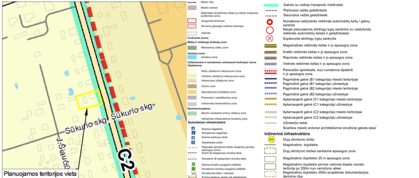
2 pav. Ištrauka iš Susisiekimo infrastruktūros brėžinio

Pagal šio plano keitimo ir jo korektūros sprendinius (žr. 1 pav.) planuojama teritorija patenka T33 nagrinėjamos teritorijos mažo užstatymo intensyvumo zoną, kurioje galima mišrios gyvenamosios teritorijos funkcinė zona. Galimi žemės naudojimo būdai (indeksai) – G1/K/I2/E/I1. Maksimalus užstatymo aukštis (aukštai) – 3. Didžiausias leistinas užstatymo intensyvumas UI sklype – 0,4.