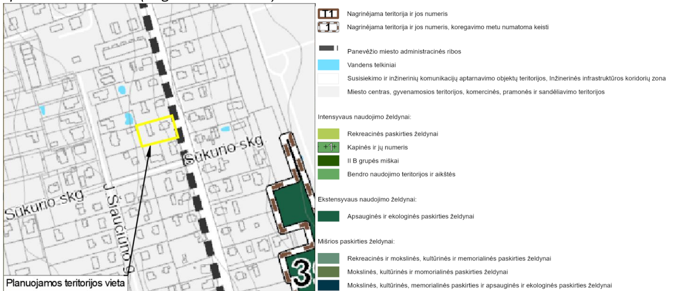
3 pav. Ištrauka iš sprendinių brėžinio

Panevėžio miesto teritorijos bendrojo plano dalies „Gamtinis karkasas ir želdynų bei rekreacijos teritorijų plėtra“ koregavimas, patvirtintas Panevėžio miesto savivaldybės tarybos 2023-12-28 sprendimu Nr. 1-140 (Reg. Nr. T00090325)