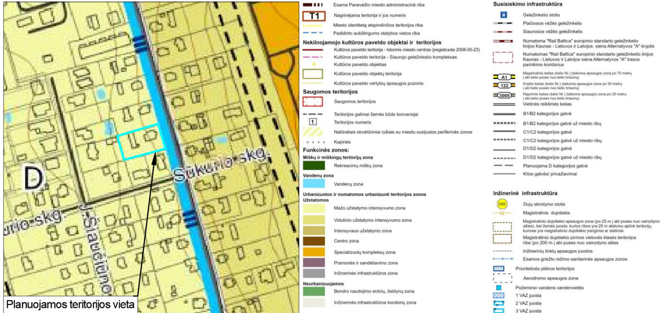
1 pav. Ištrauka iš Pagrindinio (reglamentų) brėžinio

Panevėžio miesto teritorijos bendrojo plano keitimas, patvirtintas Panevėžio miesto savivaldybės tarybos 2016-11-24 sprendimu Nr. 1-408 (Reg. Nr. T00079711) ir jo korektūra, patvirtinta Panevėžio miesto savivaldybės tarybos 2023-05-25 sprendimu Nr. 1-161 (Reg. Nr. T00089337).