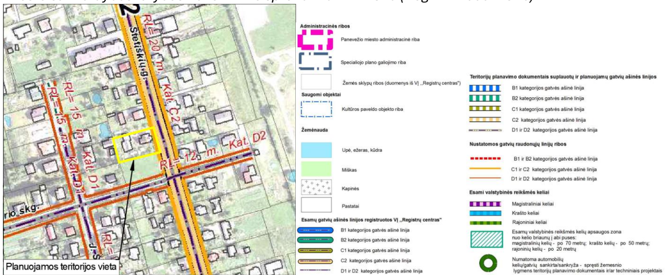
4 pav. Ištrauka iš sprendinių brėžinio

Panevėžio miesto (pietinės dalies) susisiekimo komunikacijų specialusis planas, patvirtintas Panevėžio miesto savivaldybės tarybos 2015-11-26 sprendimu Nr. 1-329 (Reg. Nr. T00077526)