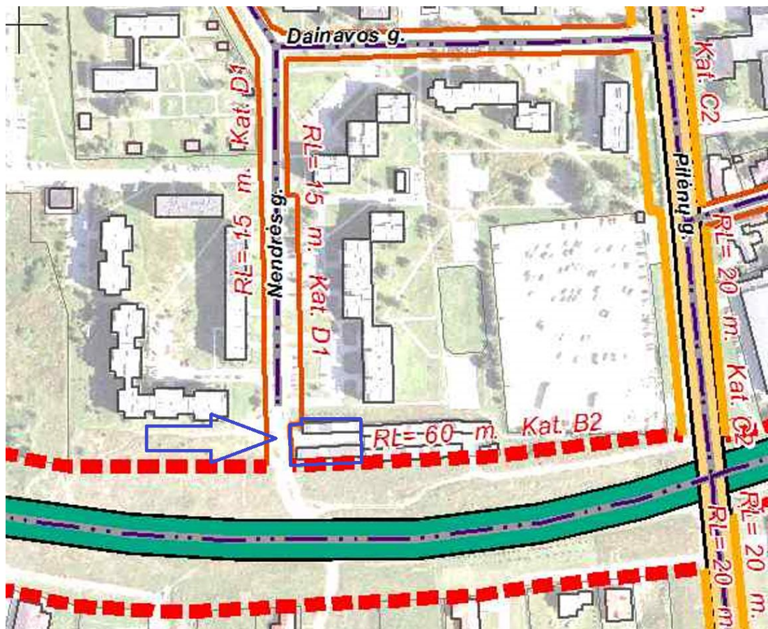
1 pav. Ištrauka iš Panevėžio miesto (pietinės dalies) susisiekimo komunikacijų specialiojo plano

Pagal Panevėžio miesto (pietinės dalies) susisiekimo komunikacijų specialiojo plano sprendinius nagrinėjamas sklypas, kadastrinis Nr. 2701/0026:0096 pietinėje dalyje ribojasi su V. Alanto g. Raudonąja linija, kurios plotis 60m. B2 kategorijos keliui/gatvei, Vakarinėje dalyje nagrinėjamas sklypas kad. Nr. 2701/0026:0096 ir įsiterpęs sklypas ribojasi su Nendrės g. raudonąja linija, kurios plotis 15m, nustatomas D1 kategorijos gatvei.