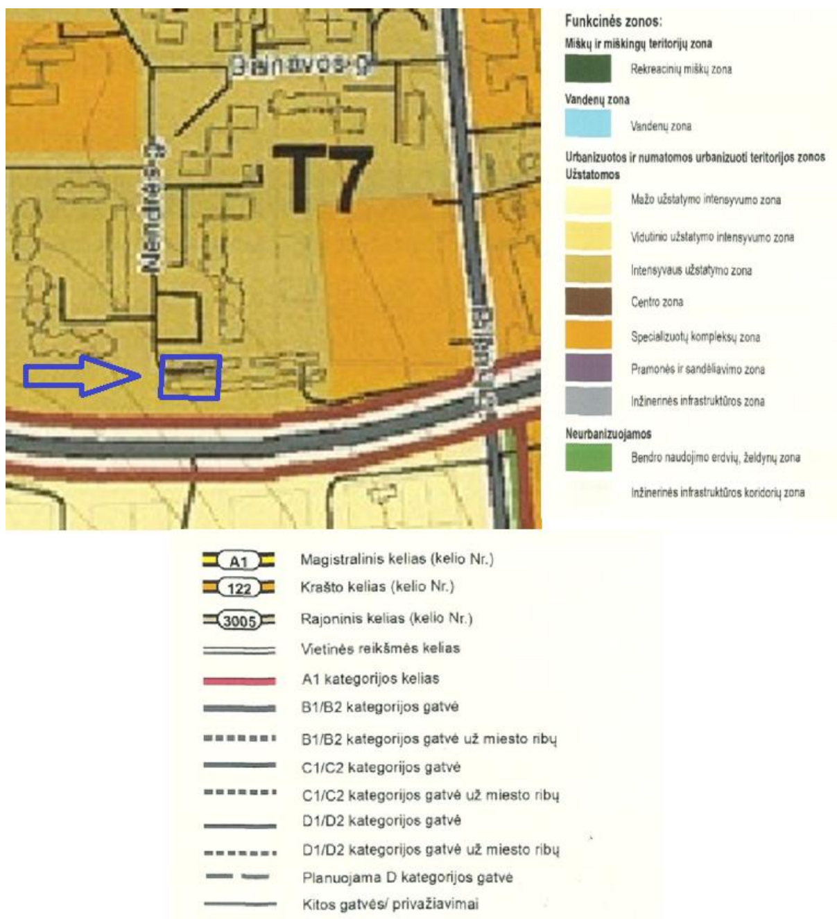
2pav. Ištrauka iš Panevėžio miesto teritorijos bendrojo plano pagrindinės žemės naudojimo ir apsaugos reglamentų brėžinio

Pagal Panevėžio miesto teritorijos bendrojo plano pagrindinės žemės naudojimo ir apsaugos reglamentų brėžinio sprendinius formuojami žemės sklypai patenka į intensyvaus užstatymo zoną bei taip pat ietinėje dalyje ribojasi su B1/B2 kategorijos gatve, vakarinėje dalyje ribojasi su D1/D2 kategorijos gatve. Formuojamas žemės sklypas pietinėje dalyje ribojasi su B2 kategorijos gatve, sklypas nepatenka į šios gatvės apsaugos zoną.