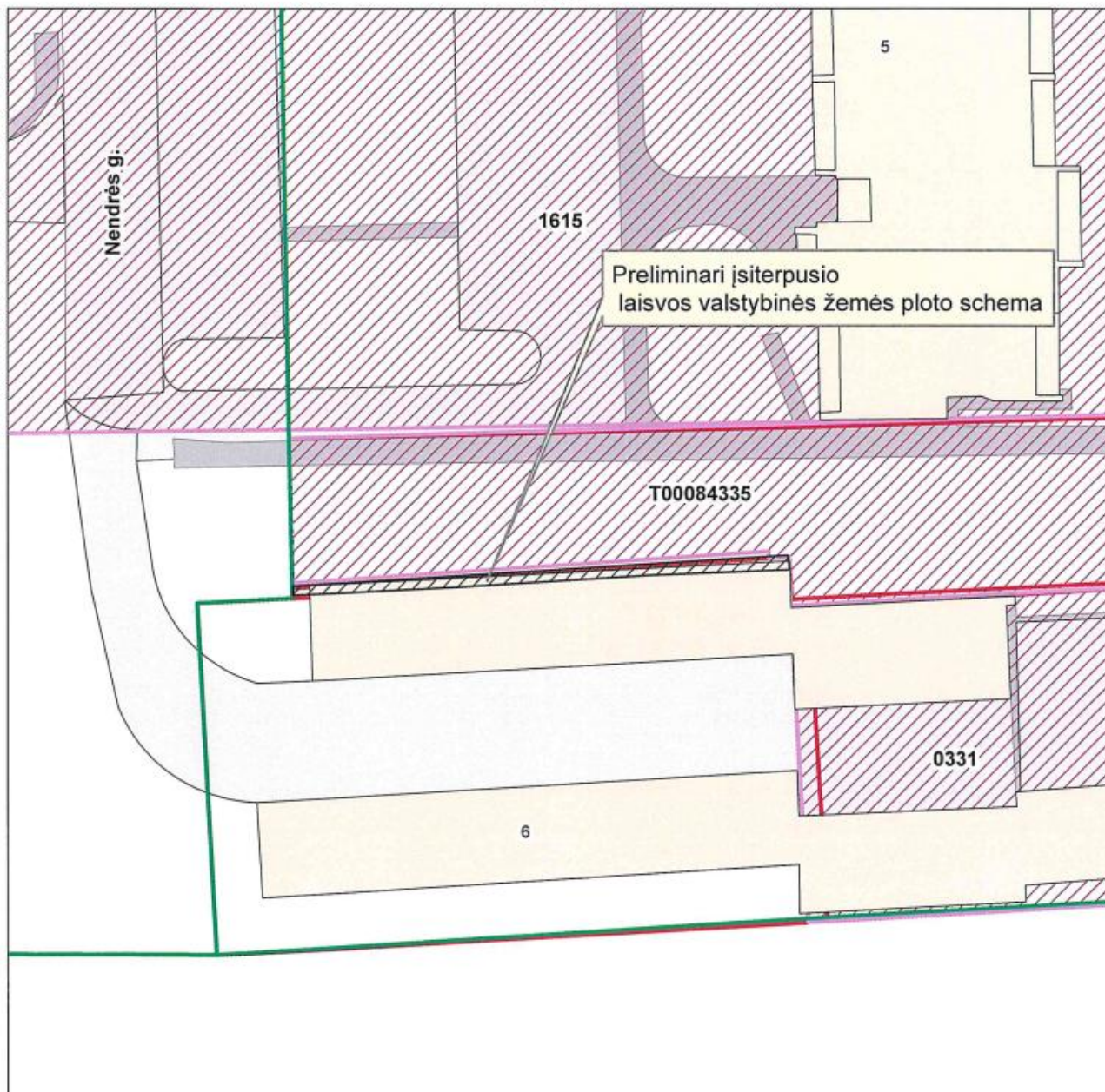
3pav. Ištrauka iš VĮ „Registrų centras“ kadastro žemėlapis