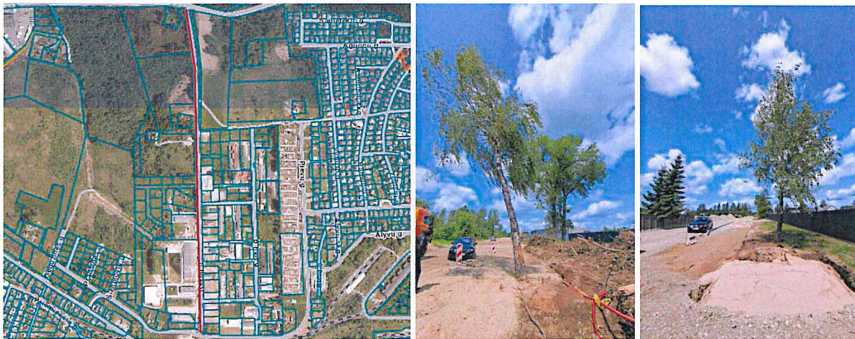
3 pav. Rėklių g. atkarpoje nuo Pievų g. iki Šiaurinės g. šalinami 22 cm skersmens ir 19 cm skersmens karpotieji beržai.