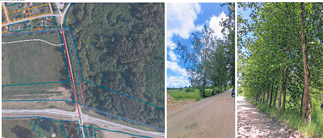
4 pav. Papildomai prašomų šalinti medžių (10 vnt. karpotųjų beržų ir 25 mažalapių liepų) augimo vieta Projekto sprendiniuose

2. Vietovėje, Rėklių g. atkarpoje nuo Šiaurinės g. iki miesto ribos (4 pav.), Komisijos nariams apžiūrėjus papildomai prašomus šalinti 35 vnt. medžių (1 lentelė), įvertinus esamą situaciją bei Rangovo paaiškinimus dėl vykdomų gatvės statybos darbų pobūdžio, siūlytina pritarti 10 vnt. karpotųjų beržų ir 25 vnt. mažalapių liepų (patikslinta rūšis vietovėje) šalinimui. Aplinkos apsaugos departamento prie Aplinkos ministerijos Panevėžio valdybos Panevėžio aplinkos apsaugos skyriaus atstovė pritarė šioje gatvės atkarpoje 35 vnt. medžių, trukdančių gatvės kapitalinio remonto darbams, pašalinimui.