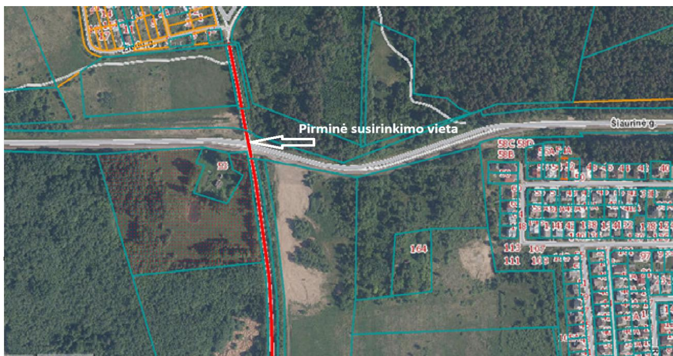
2 pav. Pirminė susirinkimo vieta Šiaurinės – Rėklių g. sankirtoje