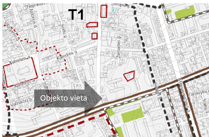
2 pav. Ištrauka iš Panevėžio miesto teritorijos bendrojo plano keitimo koregavimo