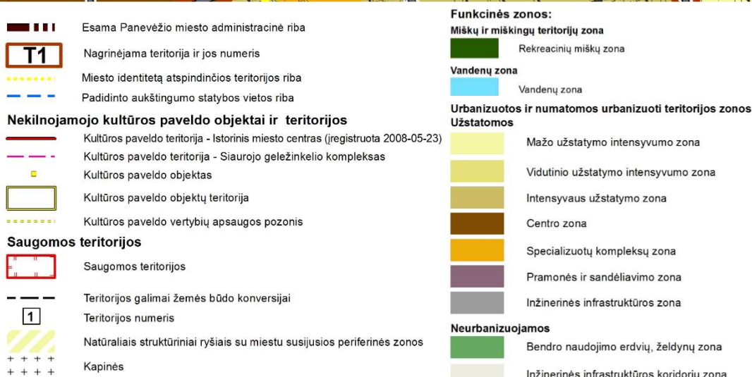
4 pav. Ištrauka iš Panevėžio miesto teritorijos bendrojo plano keitimo sprendinių pagrindinio žemės naudojimo ir apsaugos reglamentų brėžinio.

Pagal Panevėžio miesto bendrąjį planą žemės sklypas patenka į centro zoną, mišrią centro teritoriją T1. Didžiausias leistinas užstatymo intensyvumas UI 1,2 aukštų skaičius 5. Zona su visuomeninės viešosios, komercinės, gyvenamosios paskirties pastatų ir teritorijų projektavimui keliamais specialiaisiais reikalavimais architektūrai. Galimi žemės naudojimo būdai: G1/G2/K/V/R/I1/I2/B/E (V - visuomeninės paskirties teritorijos).