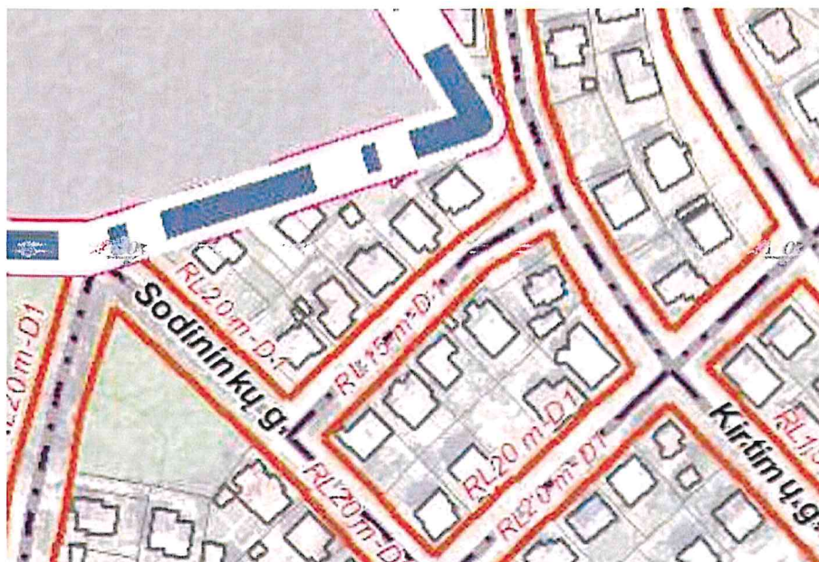
2 pav. Panevėžio miesto (šiaurės dalies) susisiekimo komunikacijų specialiojo plano fragmentas

Panevėžio miesto (šiaurės dalies) susisiekimo komunikacijų specialiojo plano (Nr. T00044538), patvirtinto Panevėžio miesto savivaldybės tarybos 2015 m. lapkričio 26 d. sprendimu Nr. 1-330, sprendiniai pateikti 2 pav. (žiūrėti 2 pav. ).