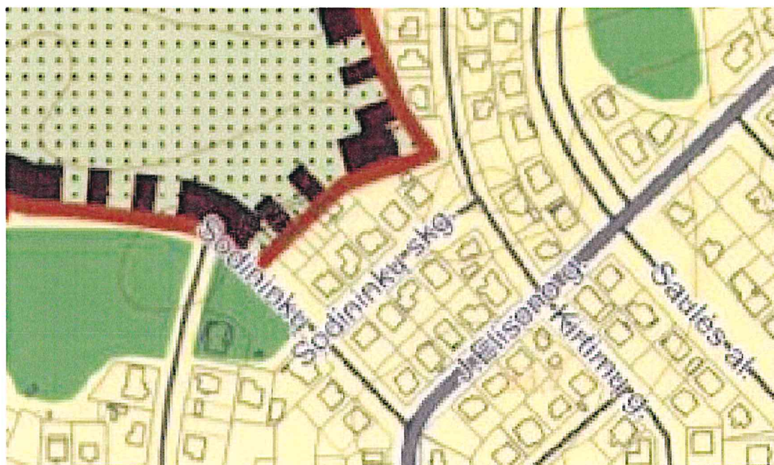
1 pav. Panevėžio miesto bendrojo plano pagrindinis žemės naudojimo ir apsaugos reglamentų brėžinio fragmentas

Panevėžio miesto bendrojo plano pagrindinis žemės naudojimo ir apsaugos reglamentų brėžinio sutartinio ženklo urbanizuotos ir urbanizuojamos teritorijos zonos – gyvenamoji zona aprašymas iš Panevėžio miesto bendrojo plano keitimą, patvirtinto 2016 m. lapkričio 24 d. Panevėžio miesto savivaldybės sprendimu Nr.1-408 aiškinamojo rašto :