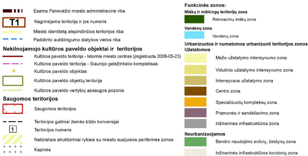
1 pav. Ištrauka iš Panevėžio miesto teritorijos bendrojo plano keitimo sprendinių, pagrindinio žemės naudojimo ir apsaugos reglamentų brėžinio