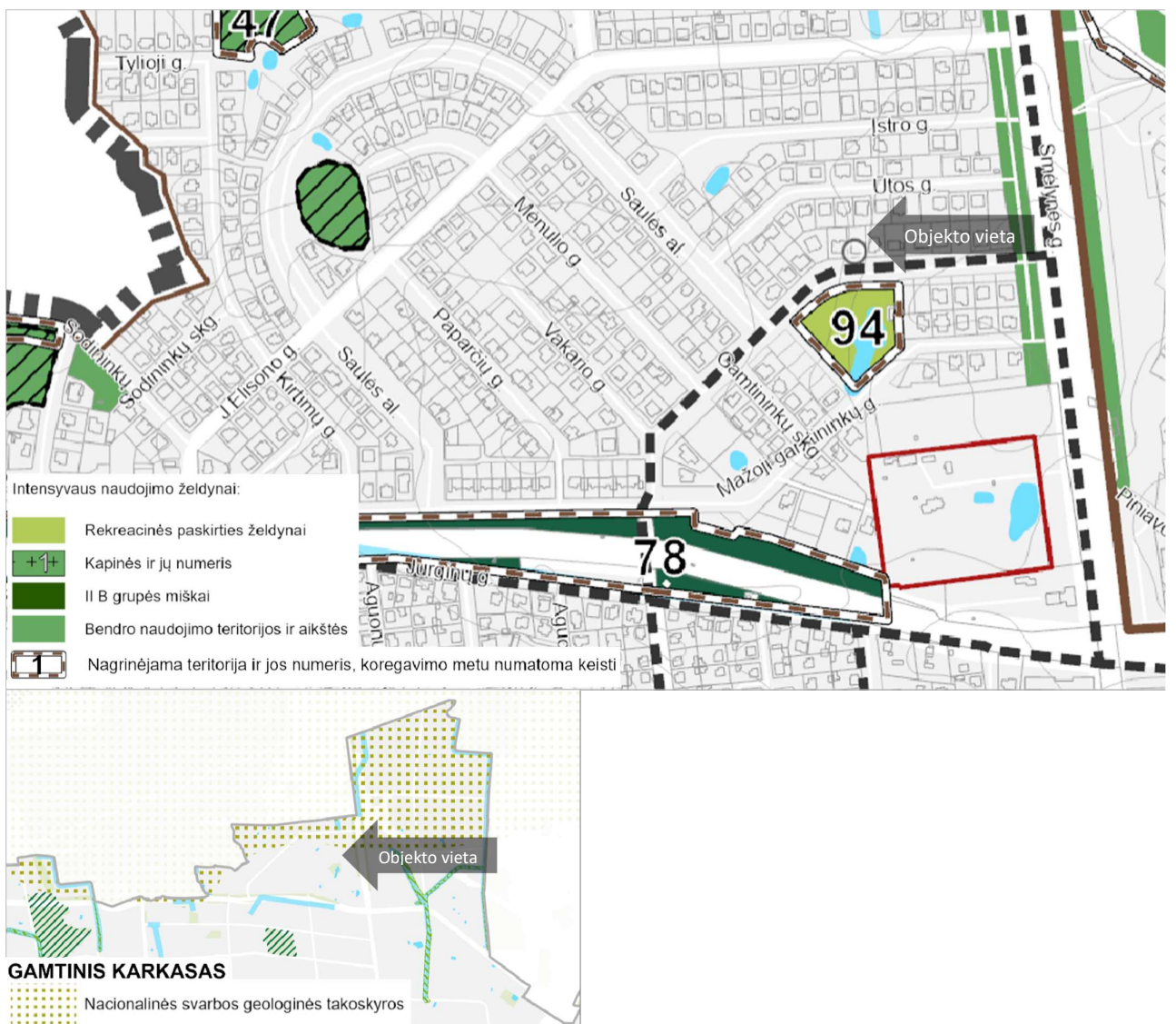
3 pav. Ištrauka iš Panevėžio miesto teritorijos bendrojo plano dalies „Gamtinis karkasas ir želdynų bei rekreacijos teritorijų plėtra“ koregavimo, atskirųjų želdynų bei rekreacinių teritorijų brėžinių