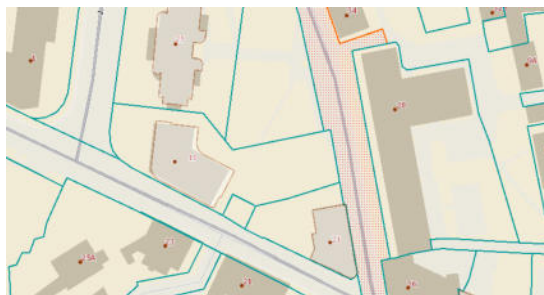
1 pav. Situacijos schema