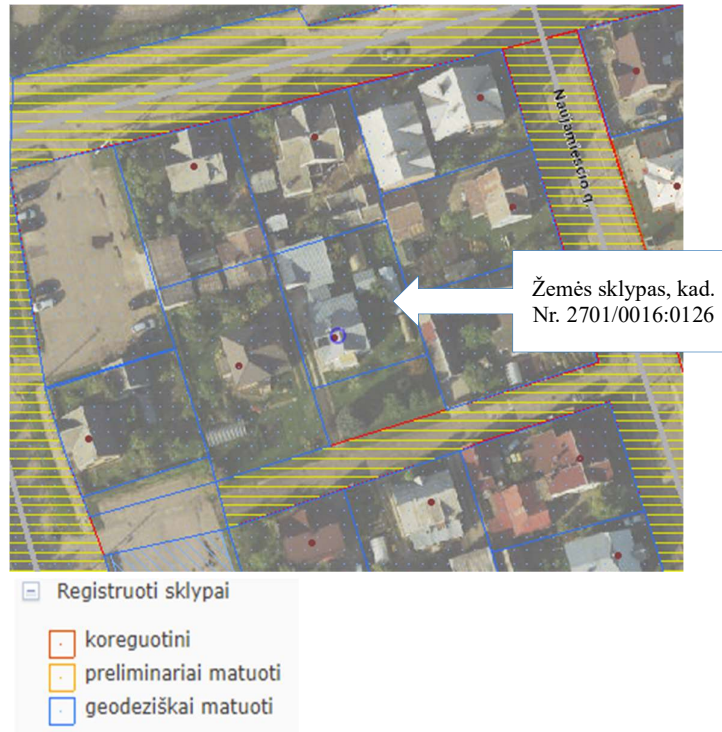
I pav. Nekilnojamojo turto kadastro žemėlapis ištrauka

Pertvarkoma teritorija – 0,0598 ha dydžio žemės sklypas, esantis Naujamiesčio g. 87A, Panevėžio m., kurio kadastrinis numeris 2701/0016:0126.