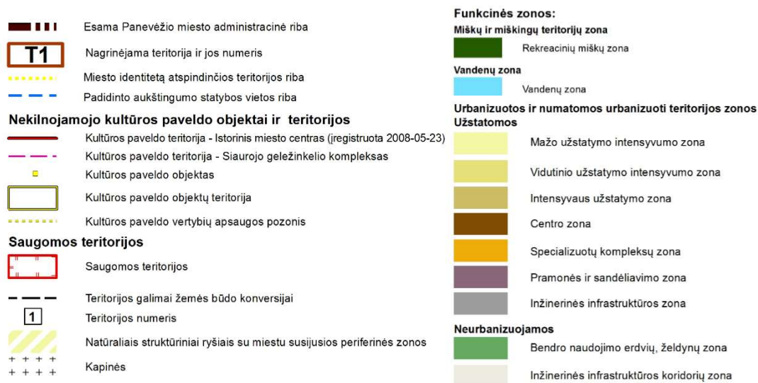
1 pav. Ištrauka iš Panevėžio miesto teritorijos bendrojo plano keitimų sprendinių pagrindinio žemės naudojimo ir apsaugos reglamentų brėžinio.