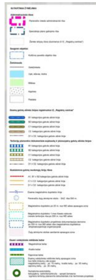
Ištrauka iš Panevėžio miesto (šiaurinės dalies) susisiekimo komunikacijų specialiojo plano.